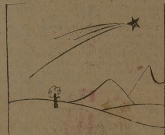
Abi está solemnemente la nueva estrella de Oriente.