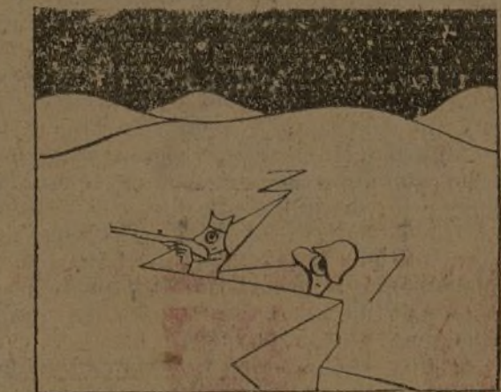
Que no pase el combatiente "su noche" muy malamente.