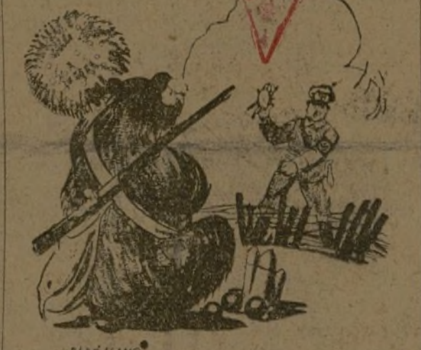
FRANCO.—Ven, ósito do; toma este pollito y entregátele, que no te haré nada. El oso.—Arrímame más; yo te dare un puñal.

La humanidad verdadera, los hombres honrados de todo el mundo están de día en día más fervientemente a nuestro lado. El espectáculo palpable y trágico de las casas de vecindad bombardeadas por la aviación extranjera con el único objeto de producir el mayor número posible de víctimas inocentes ha conmovido a la opinión mundial. En esta foto, tomada en una céntrica plaza de Madrid, nuestro fotógrafo Abun ha recogido el gesto indignado de la estatua del teniente Ruiz—uno de los héroes del Dos de Mayo—, que parece volverse lleno de ira y de dolor ante una de las casas destruidas por la metralla alemana. El cuerpo de bronce de este mártir de la Libertad, de este antiguo defensor de la patria contra la invasión extranjera, parece erguirse de nuevo al cabo de los años para gritar a Europa entera mientras empuja la espada en la mano derecha: "¡He aquí la obra de los invasores! ¡He aquí la obra de la barbarie fascista!"