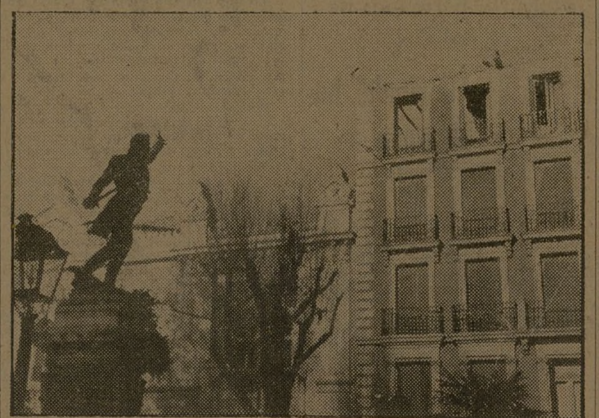
HASTA LAS ESTATUAS PARECEN INDIGNADAS CONTRA LOS CRIMENES DEL FASCISMO!

La humanidad verdadera, los hombres honrados de todo el mundo están de día en día más fervientemente a nuestro lado. El espectáculo palpable y trágico de las casas de vecindad bombardeadas por la aviación extranjera con el único objeto de producir el mayor número posible de víctimas inocentes ha conmovido a la opinión mundial. En esta foto, tomada en una céntrica plaza de Madrid, nuestro fotógrafo Abun ha recogido el gesto indignado de la estatua del teniente Ruiz—uno de los héroes del Dos de Mayo—, que parece volverse lleno de ira y de dolor ante una de las casas destruidas por la metralla alemana. El cuerpo de bronce de este mártir de la Libertad, de este antiguo defensor de la patria contra la invasión extranjera, parece erguirse de nuevo al cabo de los años para gritar a Europa entera mientras empuja la espada en la mano derecha: "¡He aquí la obra de los invasores! ¡He aquí la obra de la barbarie fascista!"