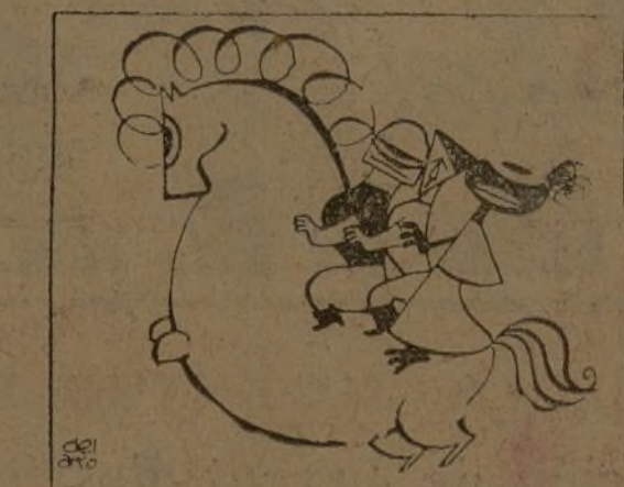
Y estos magos de Occidente ya no asustan a la gente.