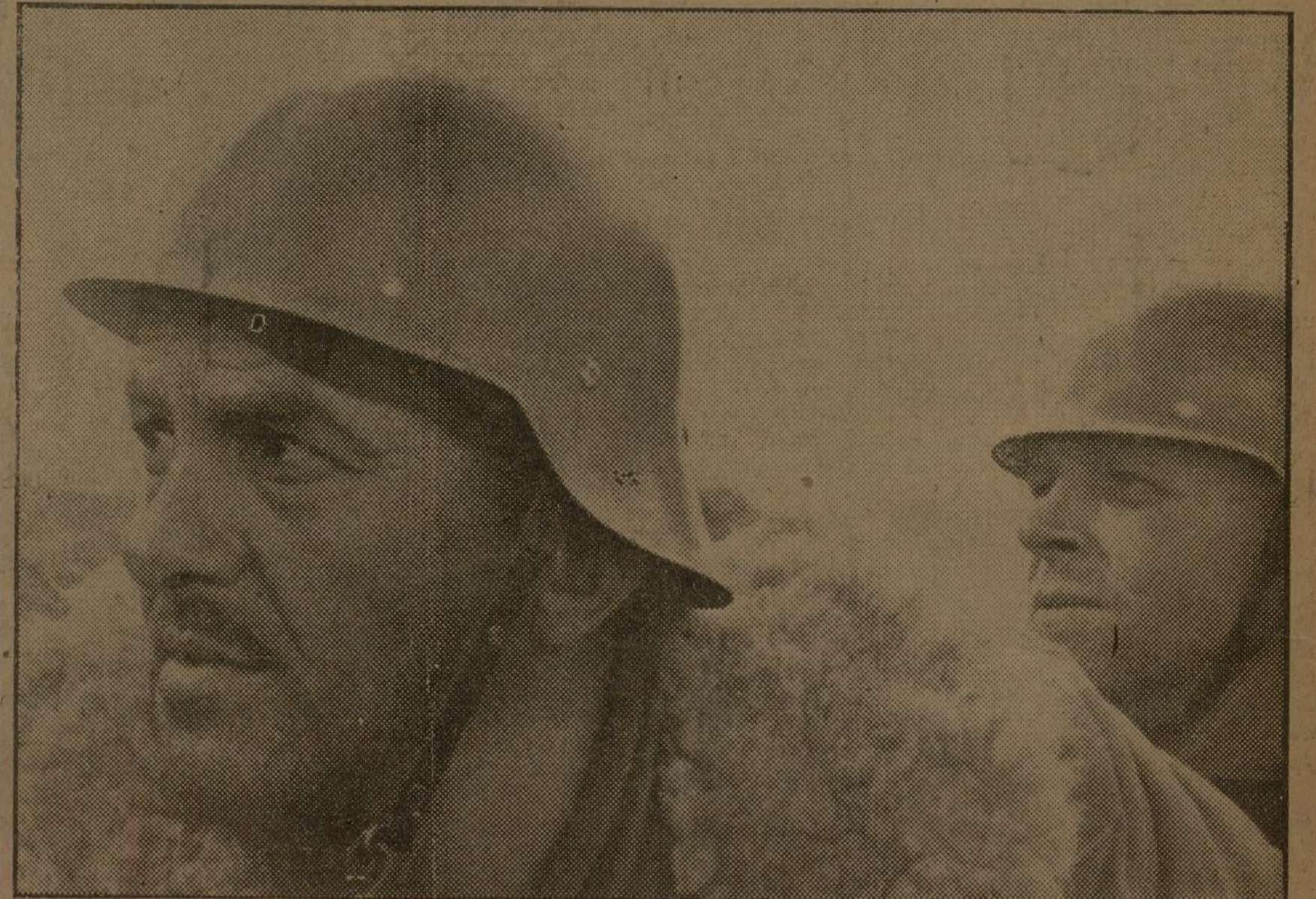
El Frente Popular de Madrid honra al auténtico Frente Popular de Europa en el homenaje a la columna Internacional. NO DEJES DE PARTICIPAR EN EL

Se mostraron complacidos por las atenciones recibidas durante el viaje.