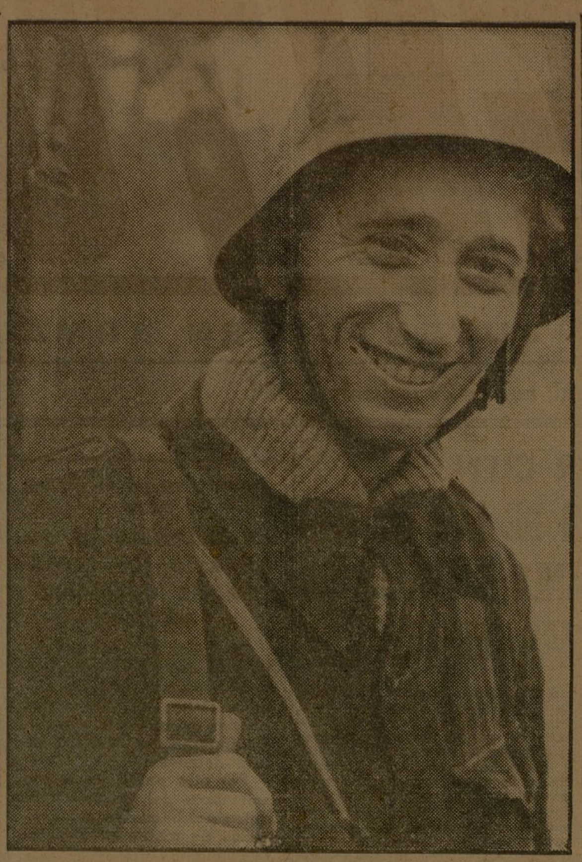
En el homenaje a la Brigada Internacional participarán todos los jóvenes de España.

Valencia, 28.—El ministro de Justicia manifestó tenía en estudio un proyecto relativo a la nacionalización de los extranjeros, los cuales tendrán que ser avalados por la organización a la que pertenecen.