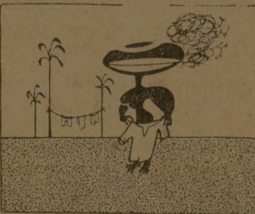
En Cuba ya no hay «batistas»... pero hay buen percal.