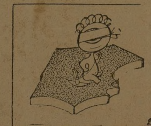
En España, chirrias y juegos florales...

1.º de enero: "AHORA", diario de la juventud en armas