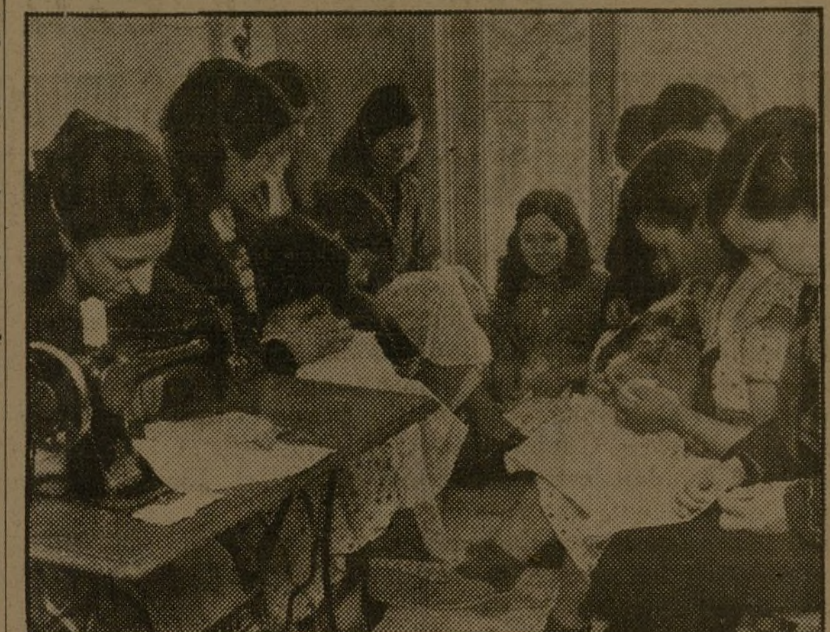
"Luchamos para destruir la injusticia social y la esclavitud de todas las mujeres."

La mujer, desde la época del marfil, ha estado sujeta a la esclavitud de la que habita en la Rusia soviética, ha vivido una doble esclavitud social y de sexo.