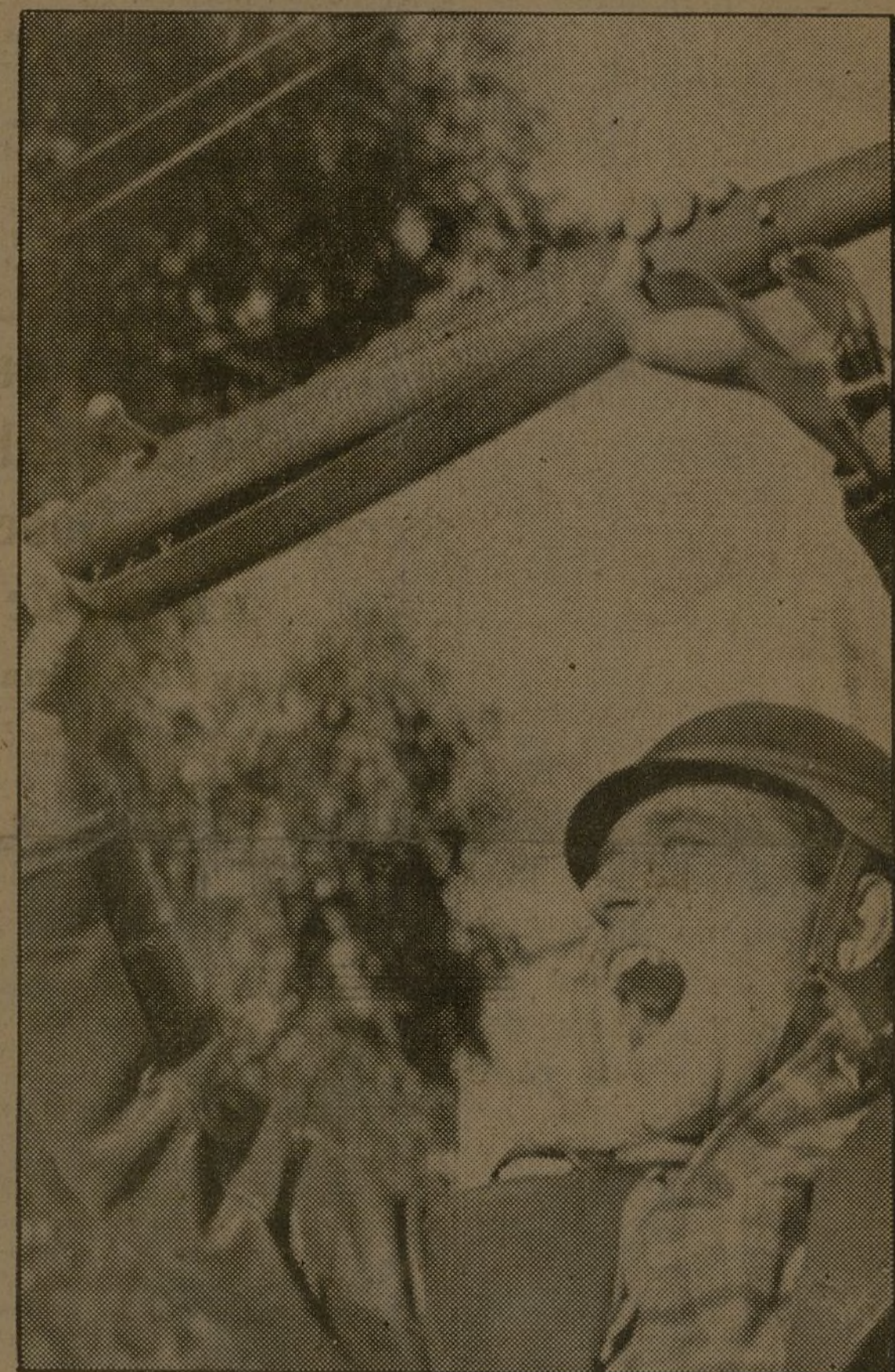
Cada palmo de terreno arrebatado al enemigo es un paso hacia la victoria del pueblo español sobre los invasores extranjeros. Al saludar un triunfo parcial el miliciano hace partícipe de su alegría al fusil.