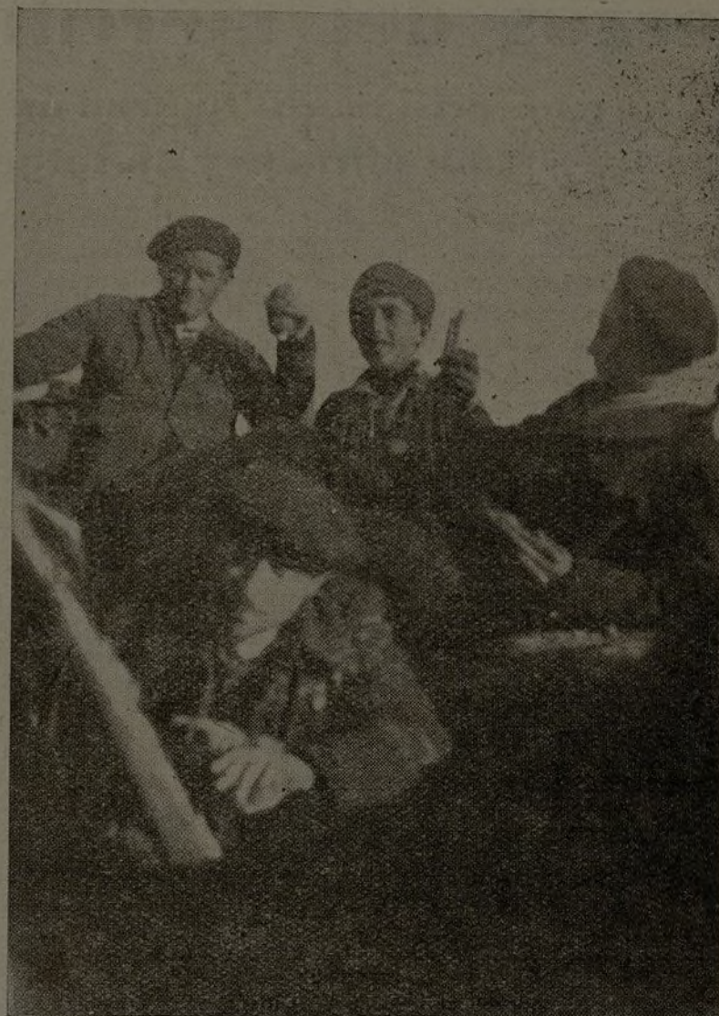
Con las bombas tomadas al enemigo, nuestros soldados inutilizan los tanques que el capitalismo internacional proporciona a los facciosos.

EL COMITÉ PROVINCIAL DEL PARTIDO COMUNISTA.