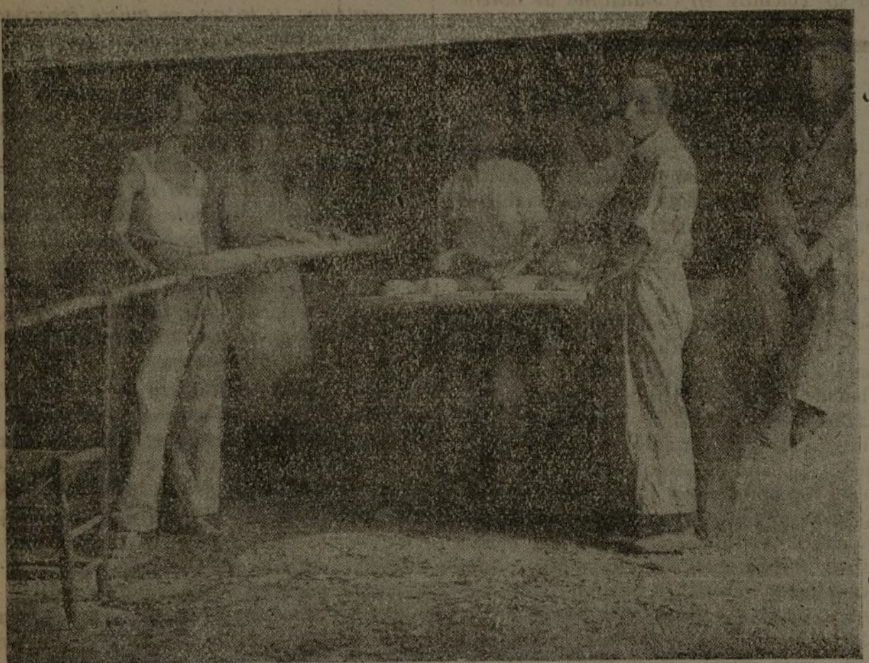
La elaboración de pan para nuestros combatientes, es una preocupación constante de estos intendentes que trabajan quince horas diarias en dicho menester.

Diez nombres que damos, no por las personas, sino por lo que simbolizan. Por lo que hacen... Son diez obreros que, con su labor constante, ayudan a ganar la guerra.