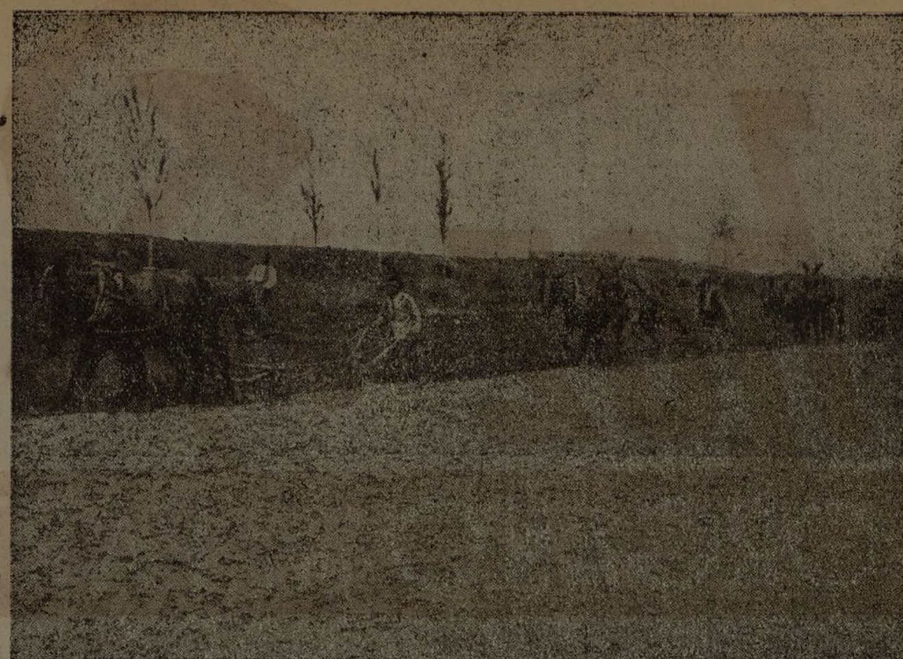
Marchamalo. — Colectivistas preparando la tierra para la siembra de la patata temprana.

Guadalajara, Imp. del Secr. de A. Concha.