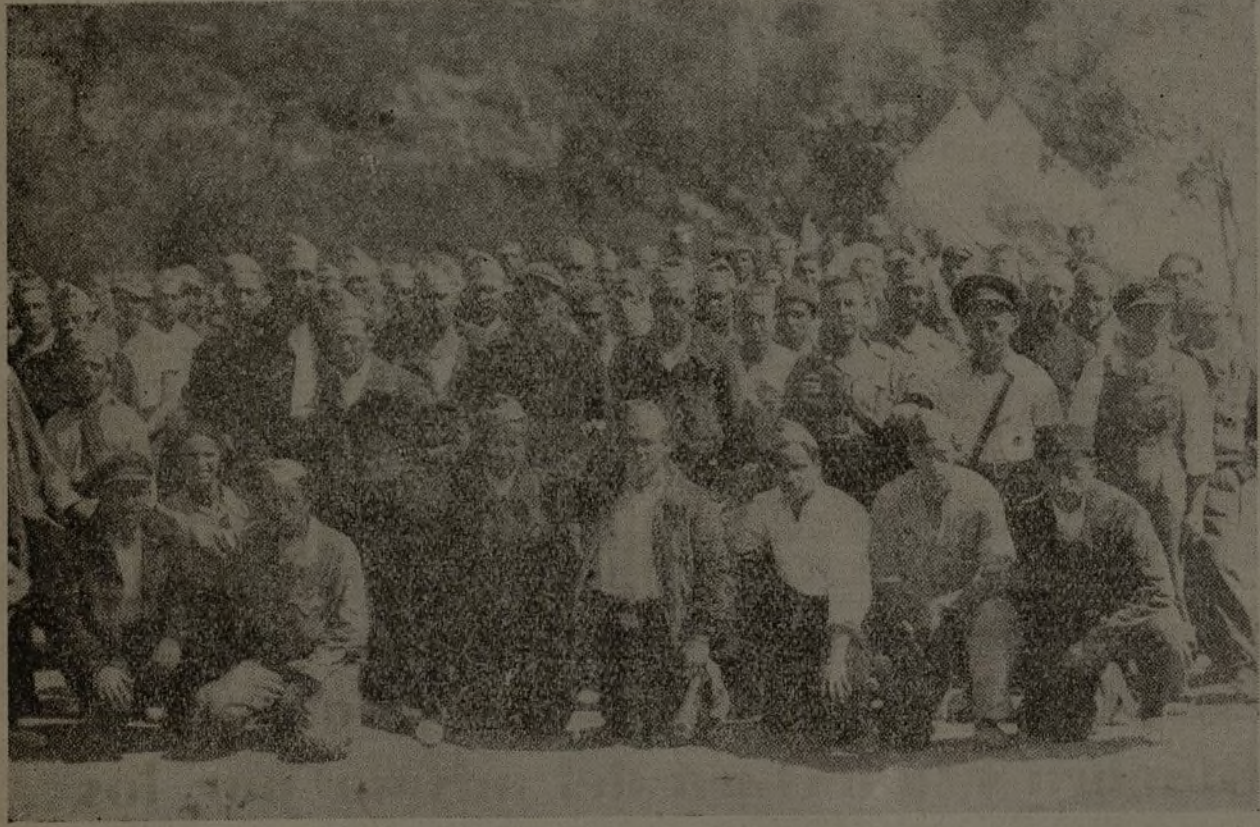
Un grupo de soldados del Primer Batallón de la 50 Brigada, que se halla descansando de sus actividades guerreras.

Magnífica finca. Rodada de árboles y sembrados, es un sitio ideal para el reposo, bien ganado por cierto, de nuestros soldados. Cuando damos vista a las tiendas de campaña que han colocado para librarse del