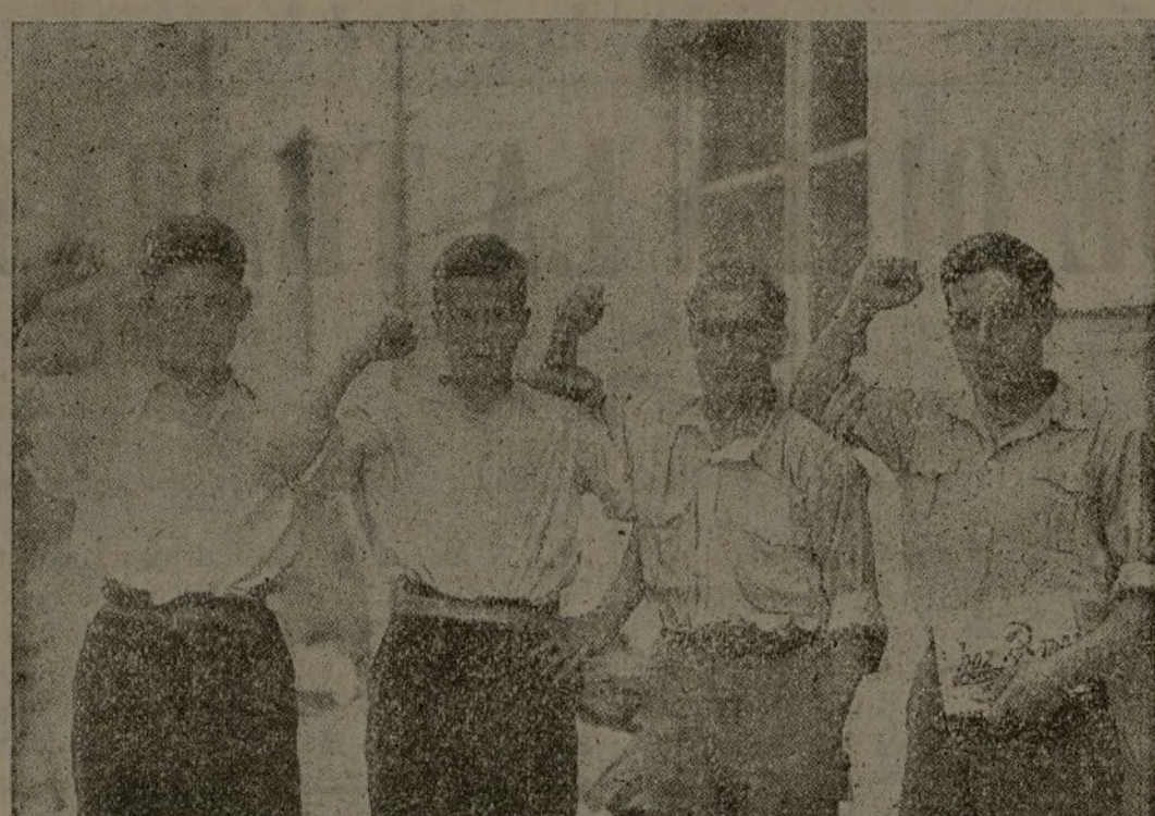
Estos cuatro jóvenes, evadidos de la zona facciosa, nos cuentan los horrores y las miserias que en ella suceden. Ahora, la alegría rebosa en sus rostros. ¡Al fin libres!