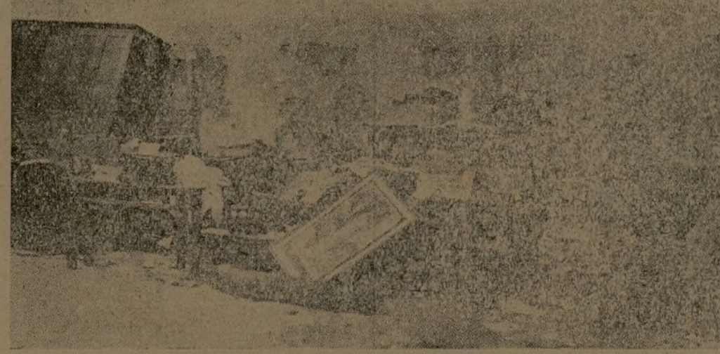
En el Asilo de Ancianos, los alemanes produjeron, desde sus aparatos "negros", un criminal incendio. ¿Qué les importan a ellos España, ni los españoles?

Toda una pequeña multitud que ensordece con sus gritos y que se hacinan en los refugios de los sótanos. Uno de los derrumbamientos ciega completamente la boca del sótano, y con el polvo, el aire enrarecido y las