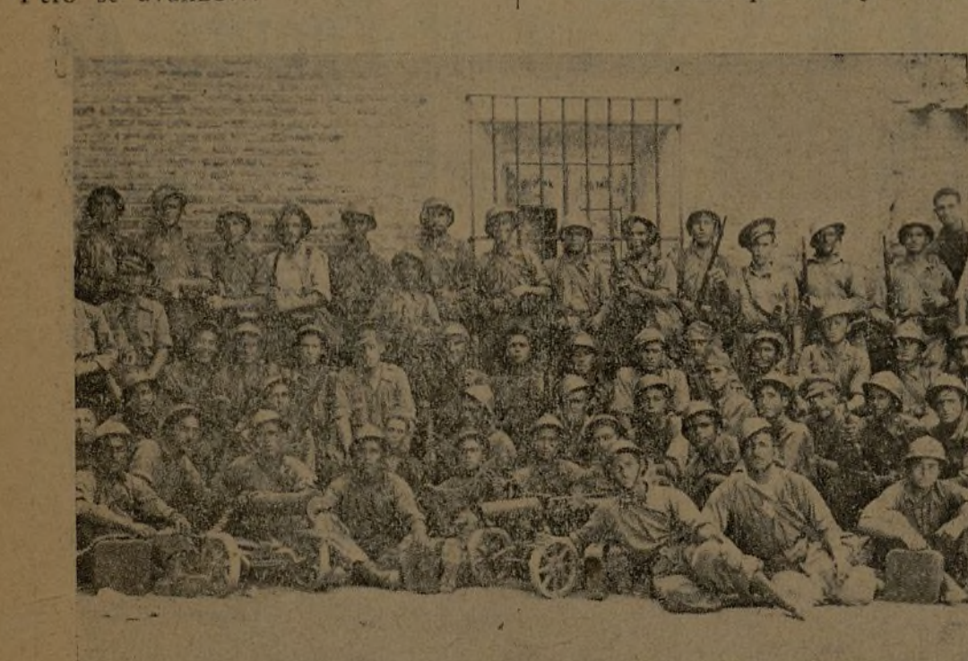
Soldados del 138 Batallón de la 35 Brigada, que acaban de realizar algunos ejercicios militares.

—Cooperó el Batallón, de una manera decisiva, a la toma de Valdearenas, Mudex y Utande. ¡Y cómo lucharon! La nieve y la lluvia habían convertido el campo de operaciones en un enorme barrizal. En esta masa pegajosa, tuvimos que librar terribles batallas. Hubo momentos en que los hombres, cubiertos totalmente de barro, no podían ni moverse. Pero se avanzó.