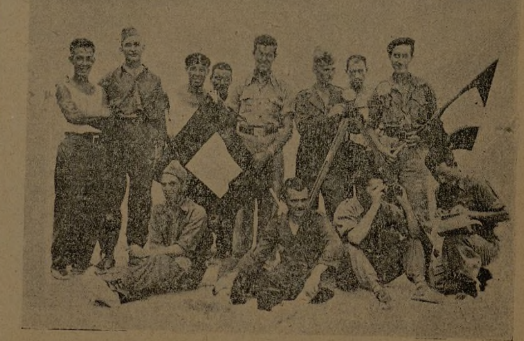
Sección de transmisiones de la 35 Brigada. En este momento comunican con una de nuestras posiciones avanzadas.