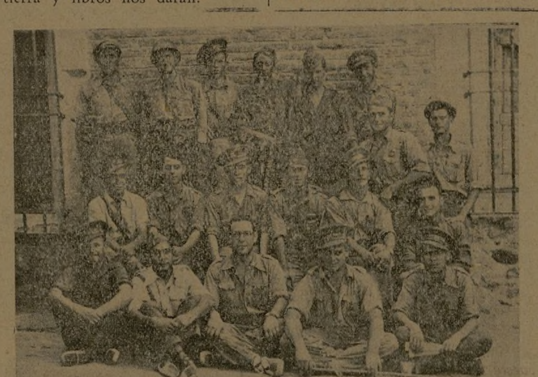
Oficiales del 138 Batallón de la 35 Brigada.

Y luego una canción, una copla: "Nuestros valientes soldados la victoria alcanzarán y a todos los campesinos tierra y libros nos darán."