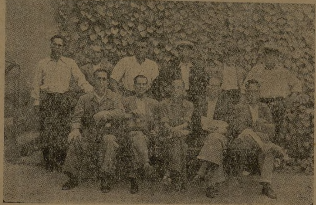
Camaradas que formaron la mesa de discusión en la Conferencia Provincial de Trabajadores de la Tierra, celebrada en esta capital, los días 28 y 29 del pasado mes de agosto.

En este aspecto, según determina el artículo 6.º del Decreto de 7 de Octubre, la reglamentación complementaria a la ordenación de la propiedad, fijará el canon que habrán de pagar al Estado. Las Colectividades abonarán la contribución correspondiente a las fincas que ellas explotan, corriendo a cargo de Reforma Agraria, el pago de la contribución perteneciente a aquellas fincas en las que se ha respetado a quienes las explotaban con anterioridad a la incautación.