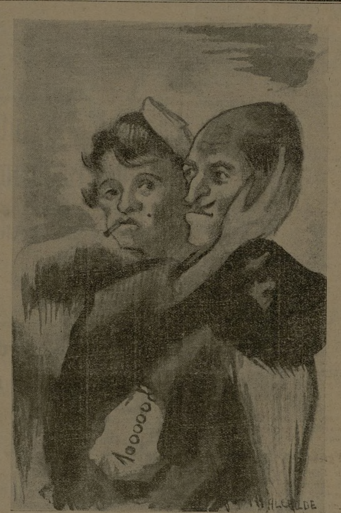
Vicio, degeneración, crimen. Esto es el fascismo de los traidores. (Dibujo de Alcalde.)