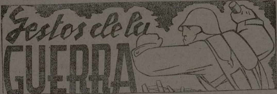
Gestos de la GUERRA

Los fascistas habían conseguido desalojar a nuestros soldados de Castañón de Henares. Con los soldados, y a fin de luchar junto a ellos, salieron algunos mozos del pueblo. Como es costumbre en los traidores, una vez dueños del pueblo, se dedicaron a cometer toda clase de atropellos y vejámenes, cebando sus iras, de una manera despiadada, en las familias de los mozos que con nuestros combatientes abandonaron aquel.