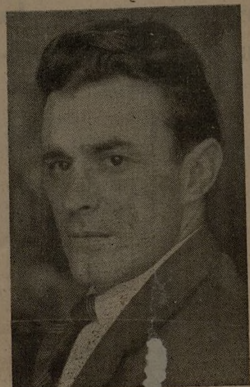
Ha sido operado felizmente el Secretario General de nuestro Comité Central, camarada José Díaz.