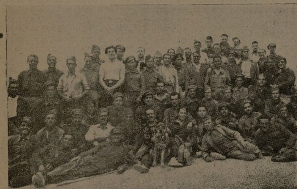
Soldados del 13 Batallón de la 65 Brigada mixta de Carabineros.

—A pesar de su larga permanencia en este frente, su moral no ha sufrido quebranto alguno.