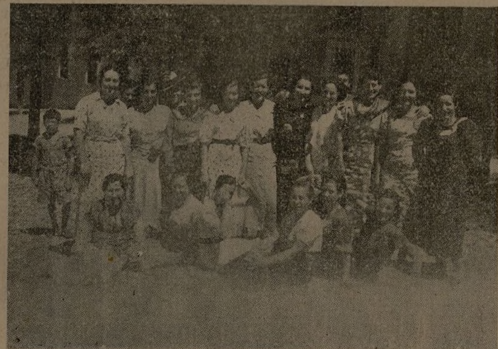
Muchachas que en nuestra provincia están desplegando una gran actividad como propagandistas antifascistas.

***** y si a pesar de los mimos y regalitos se resistía, empleaba la original frase de decirle: "Mamá; tengo ganas de ser rico para llevarme al Asilo en automóvil."