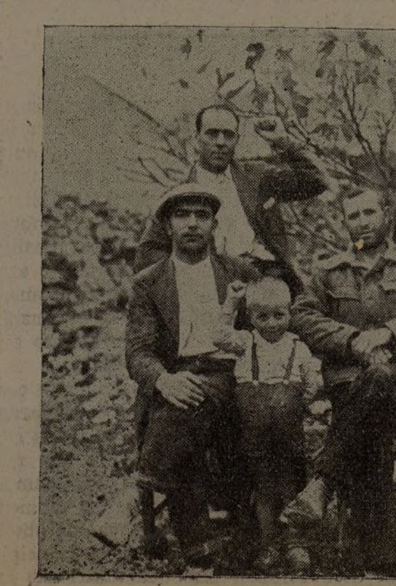
Miembros del Consejo de Administración de las fincas incautadas por la U. G. T. del pueblo de Albares.