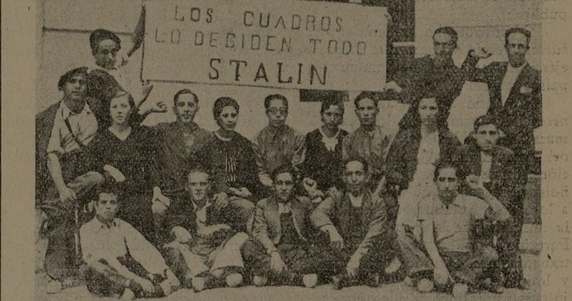
Los alumnos del primer curso de la Escuela de Cuadros de Guadalajara, exponen, con entusiasmo, esta consigna del camarada Stalin, por lo que representa en la formación de militantes activistas.

Los alumnos, pues, nos demuestran su aprovechamiento penitencioso de las explicaciones que reciben, por este medio espontáneo de expresión popular que es el periódico mural, donde manifiestan sus primeros conoci-