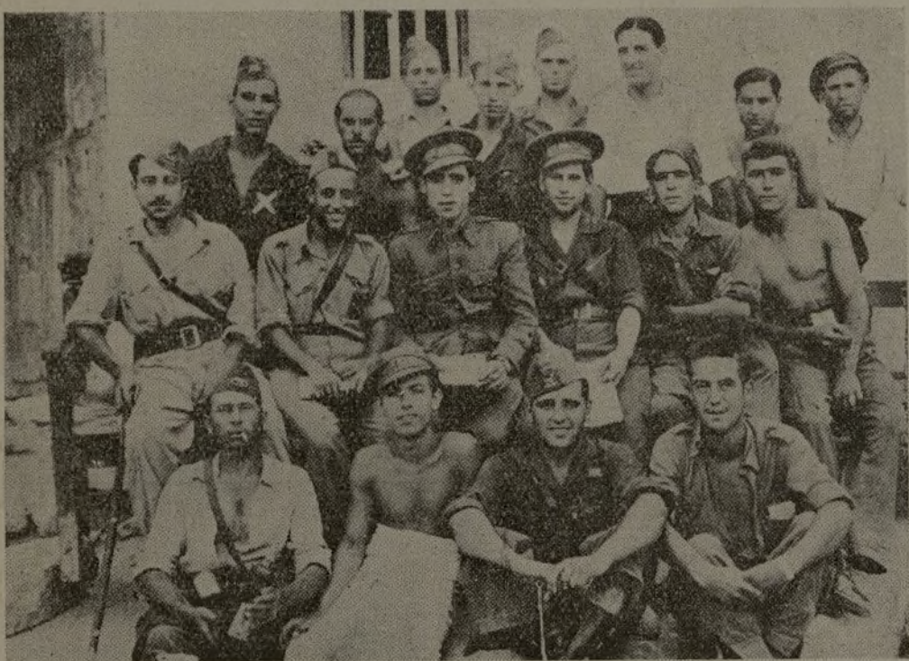
Grupo de Oficiales del Batallón "Mangada" de la 90 Brigada.