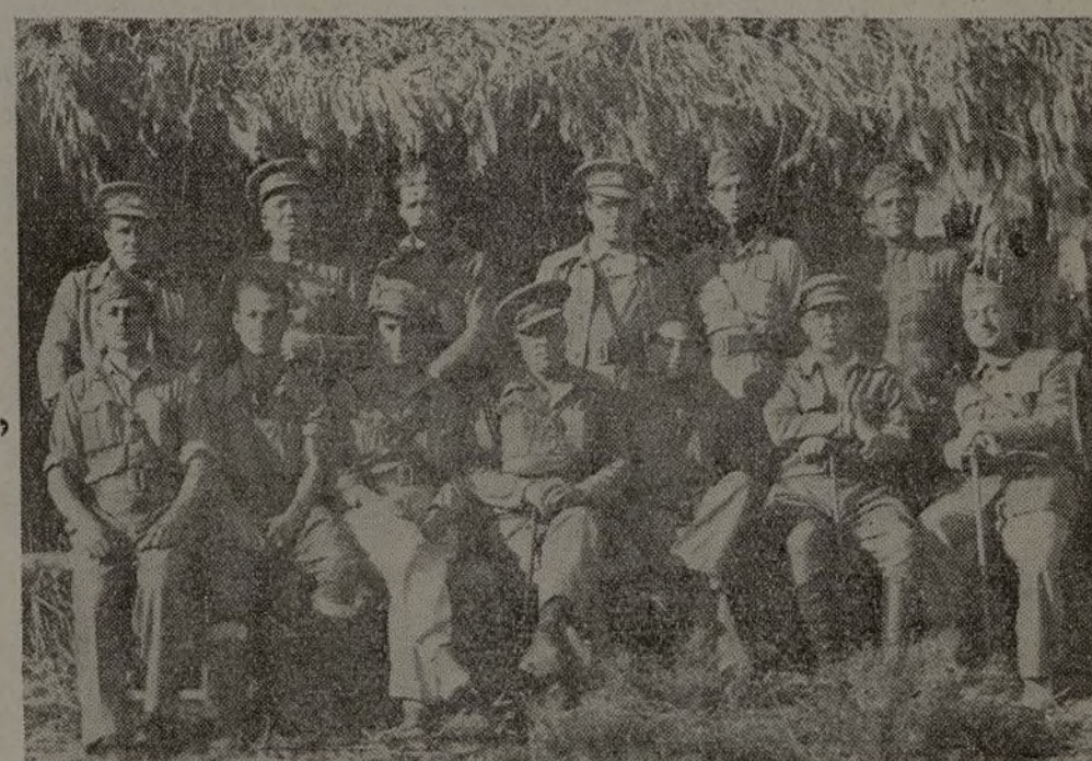
Oficiales del 11 Batallón de la 65 Brigada Mixta de Carabineros.