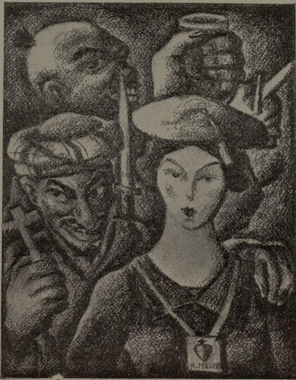
La niña requete y los nuevos bárbaros. (Dibujo de Melero.)