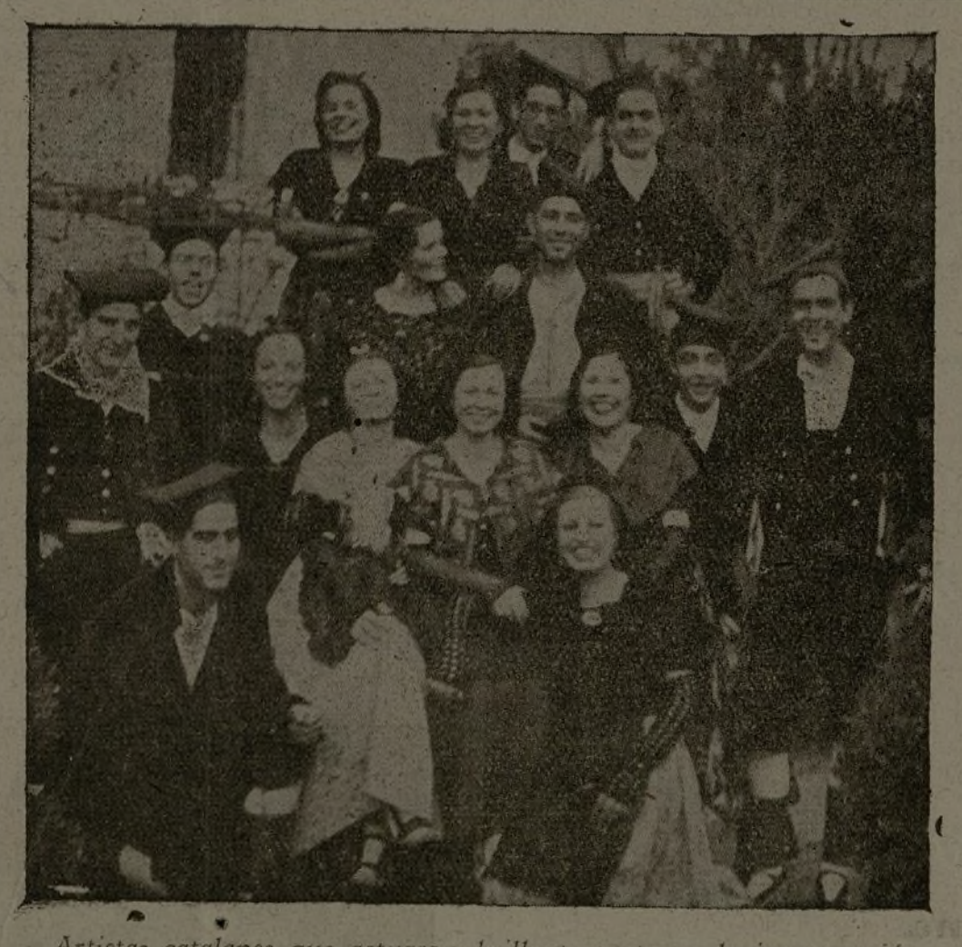
Artistas catalanes que actuaron brillantemente en la inauguración del Hogar del Combatiente en Brihuega.