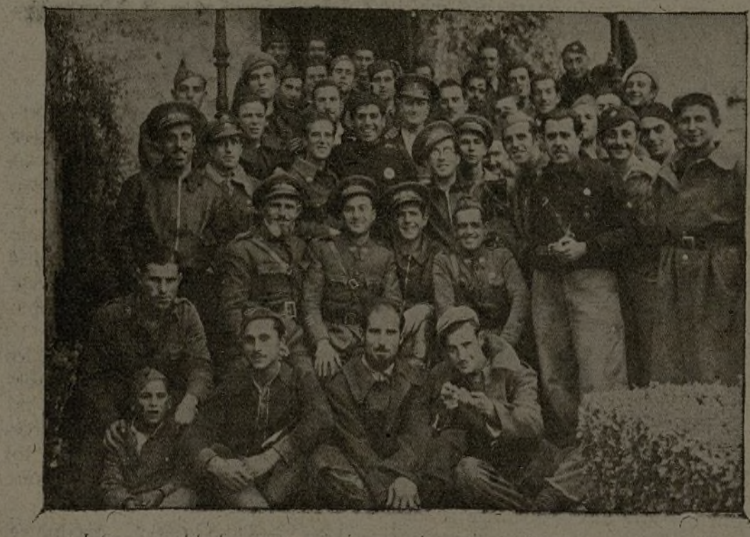
Jefes y soldados que asistieron al acto de inauguración del Hogar del Combatiente de Brihuega.