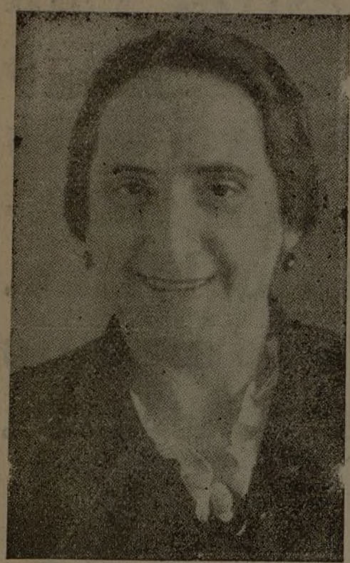
DOLORES IBARRURI "Pasionaria" del Buró del Comité Central. Ejemplo magnífico de mujer española.