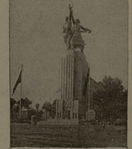
El magnífico pabellón de la U. R. S. S. en la Exposición de París.

Actualmente París celebra, con esplendor inusitado, su Exposición Universal. Instalada en las márgenes del Sena, desde la Concordia al Dupleix, le dan acceso diversas entradas monumentales, derroche de ingenio y de buen gusto, estratégicamente concebidas, de las que es la principal la del Trocadero. Aquí, en el centro de un gran anfiteatro coronado por las banderas de todos los países, una enorme columna con esta inscripción: Paz. ¡Paz!; y aquí están, sin embargo, junto a nuestras banderas, las de Italia, Alemania y otros pueblos de nombres igualmente siniestros.