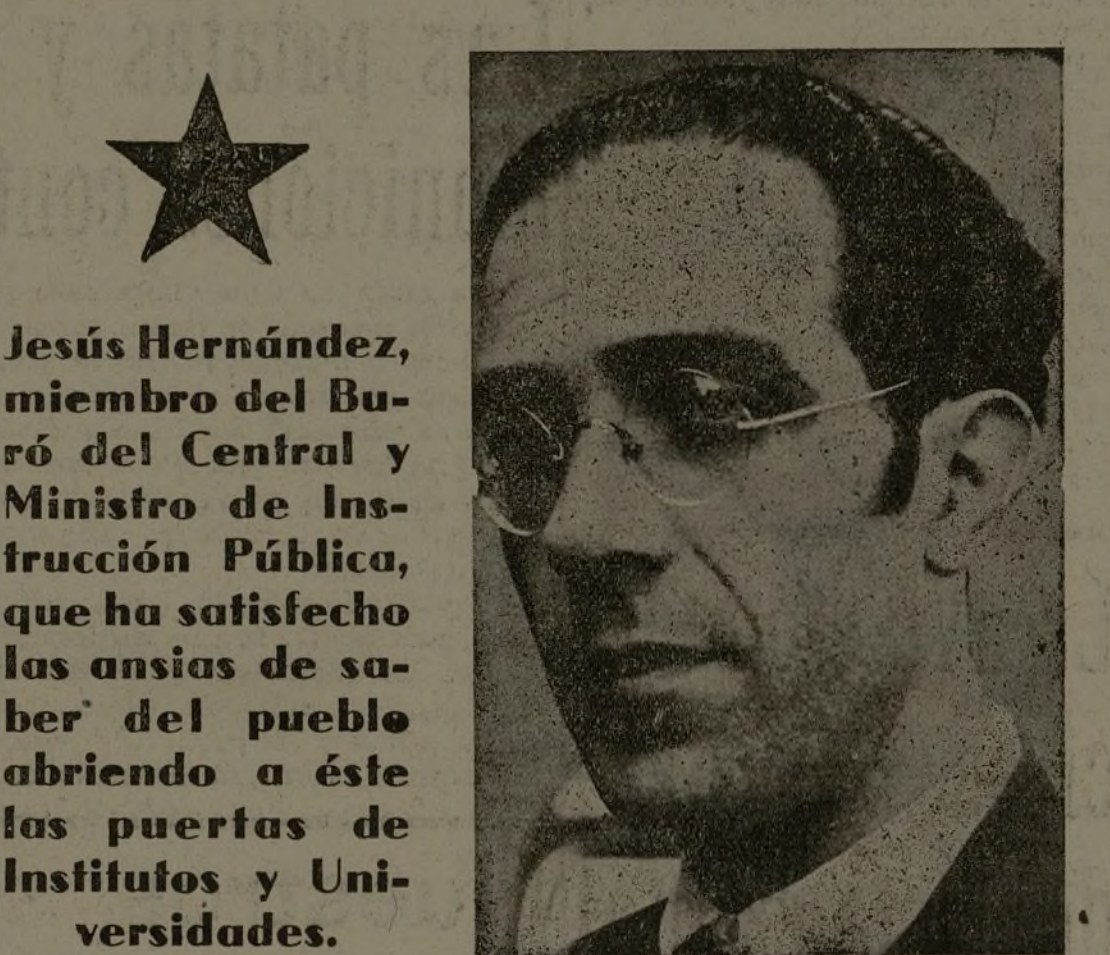
Jesús Hernández, miembro del Buró del Central y Ministro de Instrucción Pública, que ha satisfecho las ansias de saber del pueblo abriendo a éste las puertas de Institutos y Universidades.

Reunidos con el Radio de Budia los Radios de Mantiel, Viana, Durón y El Olivar, se aprobó totalmente las resoluciones del Pleno de nuestro Comité Central, y de una manera especial, aquella que se refiere a compromisos con el enemigo. No queremos compromisos humillantes, y lucharemos con el Frente Popular hasta la derrota total de los invasores.