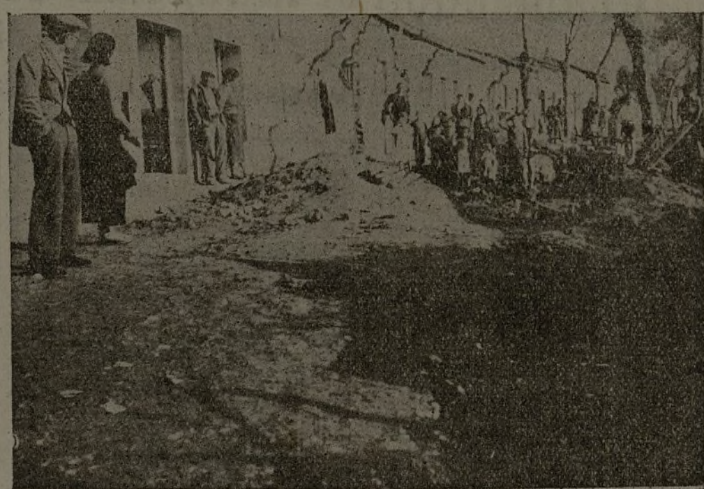
Un ejemplo vivo, caliente aún, es nuestro popularísimo y proletario barrio del "Alamin".

Tan justo nos parece este ascenso, que nos ahorra el comentario