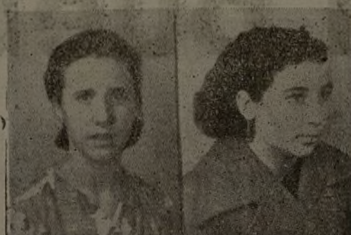
Comisión de Prensa en los

camaradas activistas que con todo entusiasmo ayudan a nuestra Comisión de Prensa en los trabajos complementarios de HOZ Y MARTILLO.