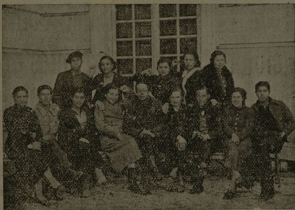
Ha finalizado el tercer curso de nuestra Escuela de Cuadros. Los alumnos se muestran satisfechos por el aprovechamiento con que han hecho el curso.