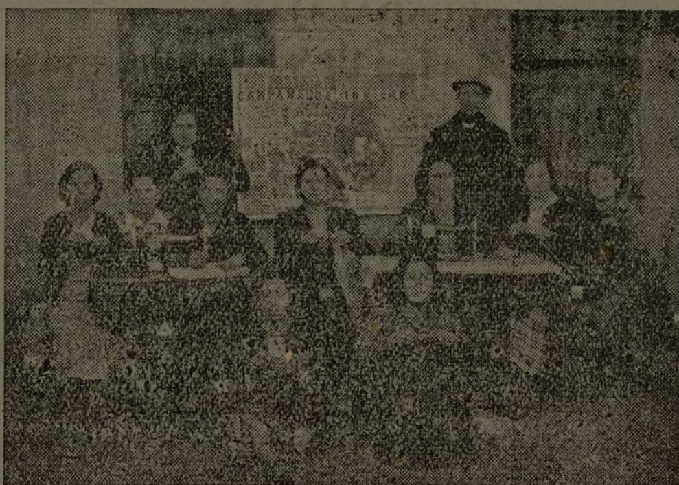
En Cabanillas del Campo, el grupo del S. R. I. tiene unas magníficas colaboradoras que se afanan en confeccionar ropas de abrigo para nuestros soldados.

El Partido Comunista ha luchado y seguirá luchando tenazmente por la unidad. Si eso le hace chocar con los enemigos de ella, el choque servirá para enseñar a los trabajadores a distinguir a tiempo dónde están sus enemigos encubiertos. Es por esto que decimos que la mejor contestación al escrito de Tobajas está en el manifiesto anterior, cuyos firmantes son todos del Partido Socialista, fundadores y dirigentes de la Federación Nacional de Trabajadores de la Tierra y de Federaciones Provinciales. No son comunistas quienes lanzan, públicamente, su confesión contra quienes quieren hacer de los Trabajadores de la Tierra un instrumento para realizar una política cacial y personalista contraria a la unidad. Son todos militantes del Partido Socialista.