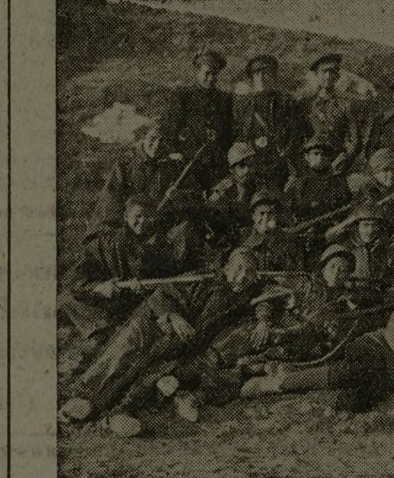
Grupo de "jabatos" del 357 Batallón de la 90 Brigada.