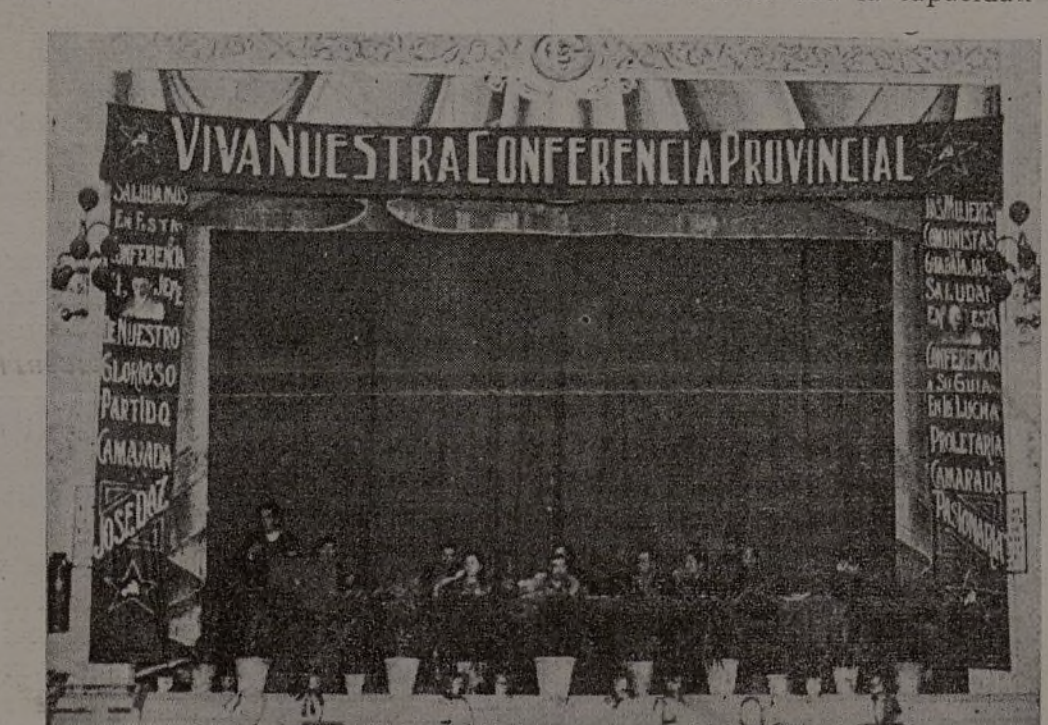
Presidencia de nuestra IV Conferencia Provincial.

Expone el estado de los trabajos del Frente Popular en nuestra provincia, analizando su composición; no todos los que están en el F. P. lo hacen con la misma lealtad que los comunistas, y ello hace que el trabajo sea débil. Relación los problemas que deben ser objeto de examen por el F. P., y dice que la cuestión, como dijo José Díaz, no es la de darle tal o cual nombre, sino coincidir en su contenido, ya que no es mera suma de partidos y organizaciones, sino plataforma de actuaciones conjuntas.