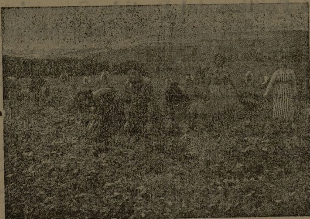
Como estas abnegadas mujeres, todas las campesinas deben incorporarse urgentemente a las tareas agrícolas para sustituir a los hombres que se incorporan al Ejército del pueblo, a fin de que nada le falte a éste en su lucha contra los criminales invasores.

Se pone en conocimiento de los suscriptores que no reciban nuestro semanario HOZ Y MARTILLO, con la debida regularidad, se pasen por esta Administración, con el fin de examinar las causas y ponerlas en práctica rápidamente.—El Administrador.