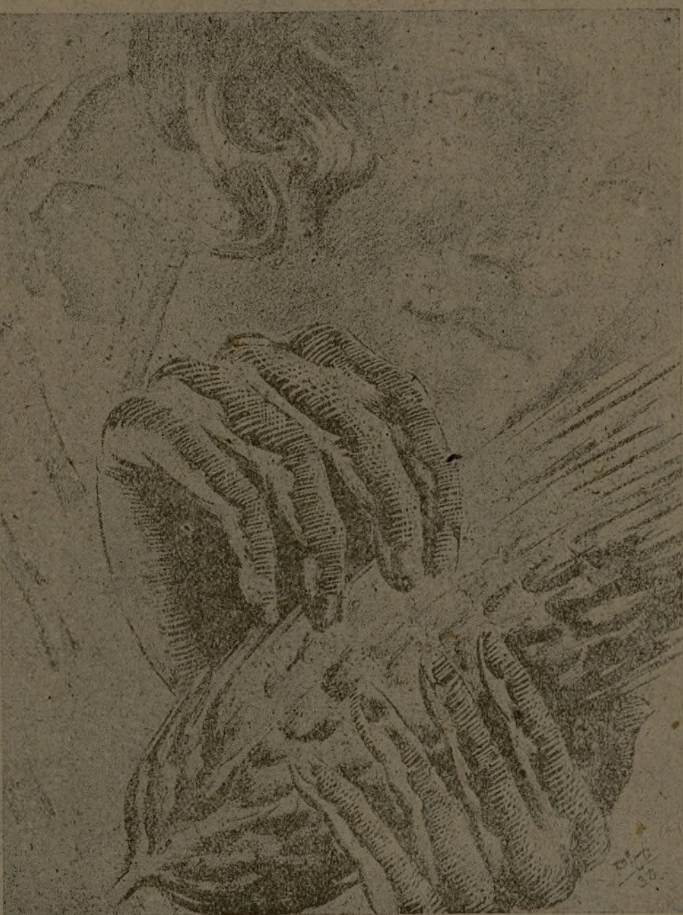
La cosecha exige la movilización de todos nuestros recursos para su recogida. La mujer es un caudal de energías que se incorpora ya en la provincia a las faenas de la recolección.