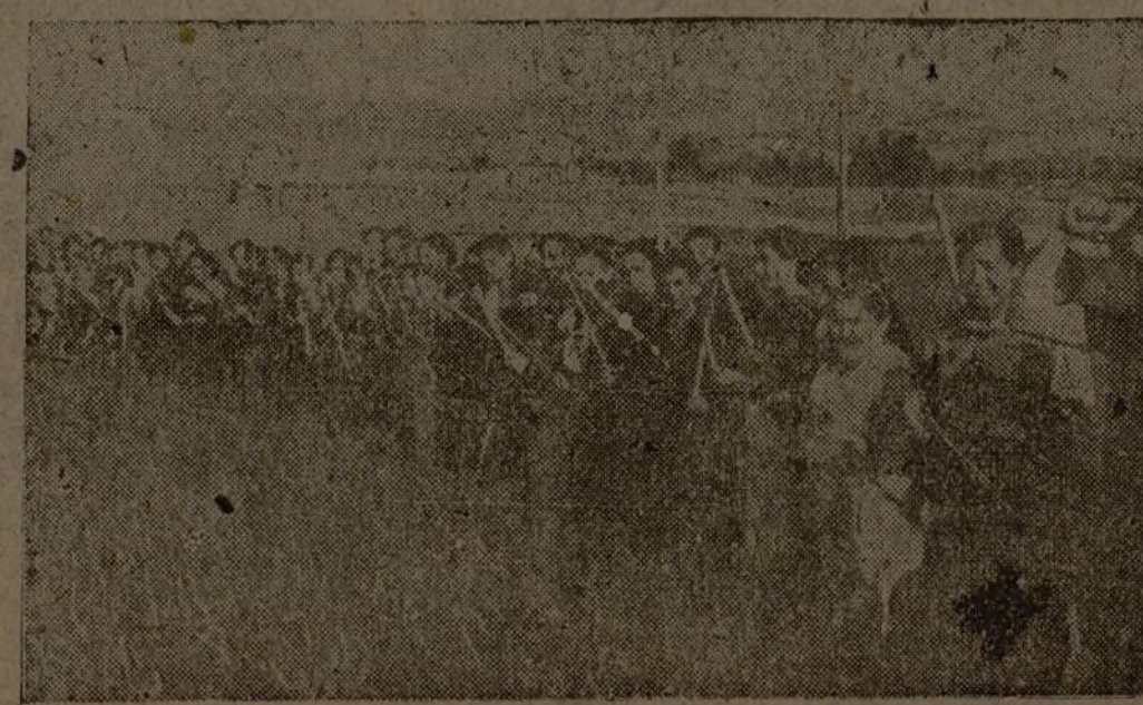
Campeños y campesinas en plena recolección.

En un marco de entusiasmo, banderas y pancartas, bajo un arco de follaje elevado en honor de los combatientes, se celebró el segundo aniversario de nuestra lucha.