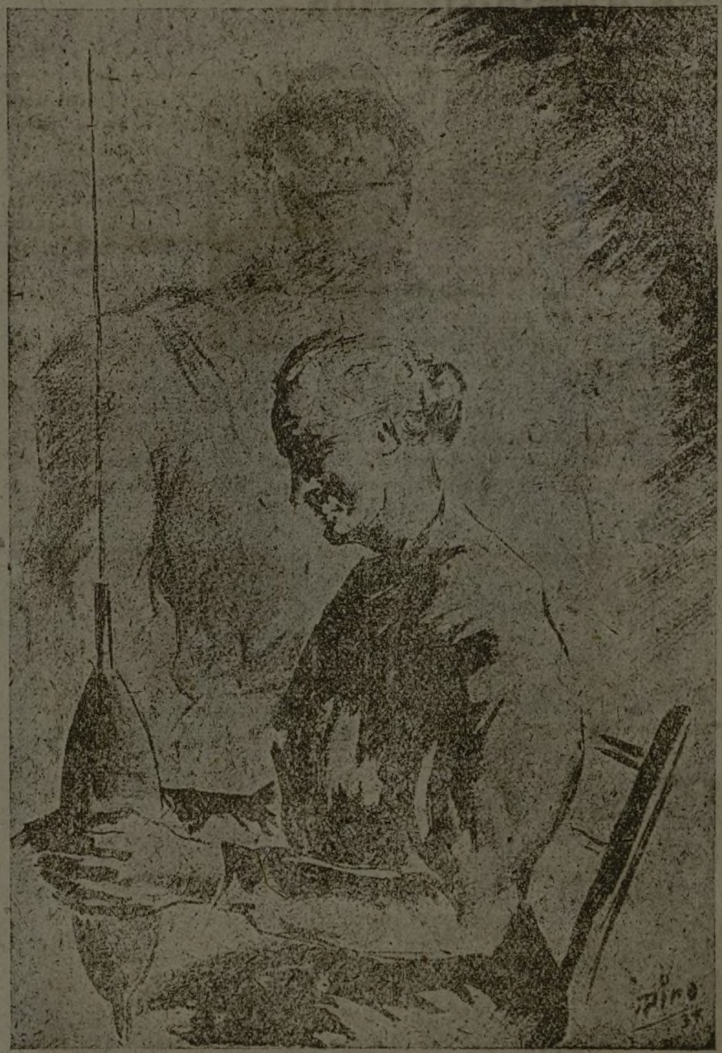
Trabajando en el hogar, también puede ayudarse a la Campaña de Invierno. (Dibujo de Piro.)