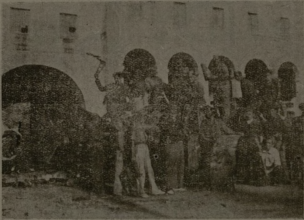
Combatientes del Batallón de Retaguardia, descargando la camioneta de recuperación.