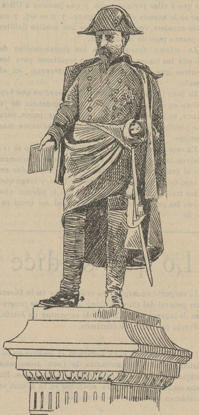
Estatua del Duque de Ahumada.

Muntadas colocó al Colegio en tan excepcionales condiciones, que podemos afirmar que, de su época salieron los jóvenes de más instrucción y que más honran hoy al establecimiento. Si los estrechos moldes en que nos movemos para trazar estas líneas, fueran factible ampliarlos, con cuánto gusto copiaríamos algunas de las hermosas órdenes que el capitán Muntadas daba á los pequeños militares. Muntadas era un hombre excepcional. Con igual facilidad discurría su privilegiada inteligencia una circular, explicando un sistema para la enseñanza moral y religiosa, tan notable, que el mismo Cardenera y otros pedagogos insignes, hubieran envidiado, como más tarde su corazón de soldado, y especiales condiciones de Guardia civil hacían de él un verdadero guerrillero, persiguiendo, por barrancos y vericuetos á los tenaces criminales de los montes de Toledo. Jefes como Muntadas, quedan siempre en las páginas del Instituto.