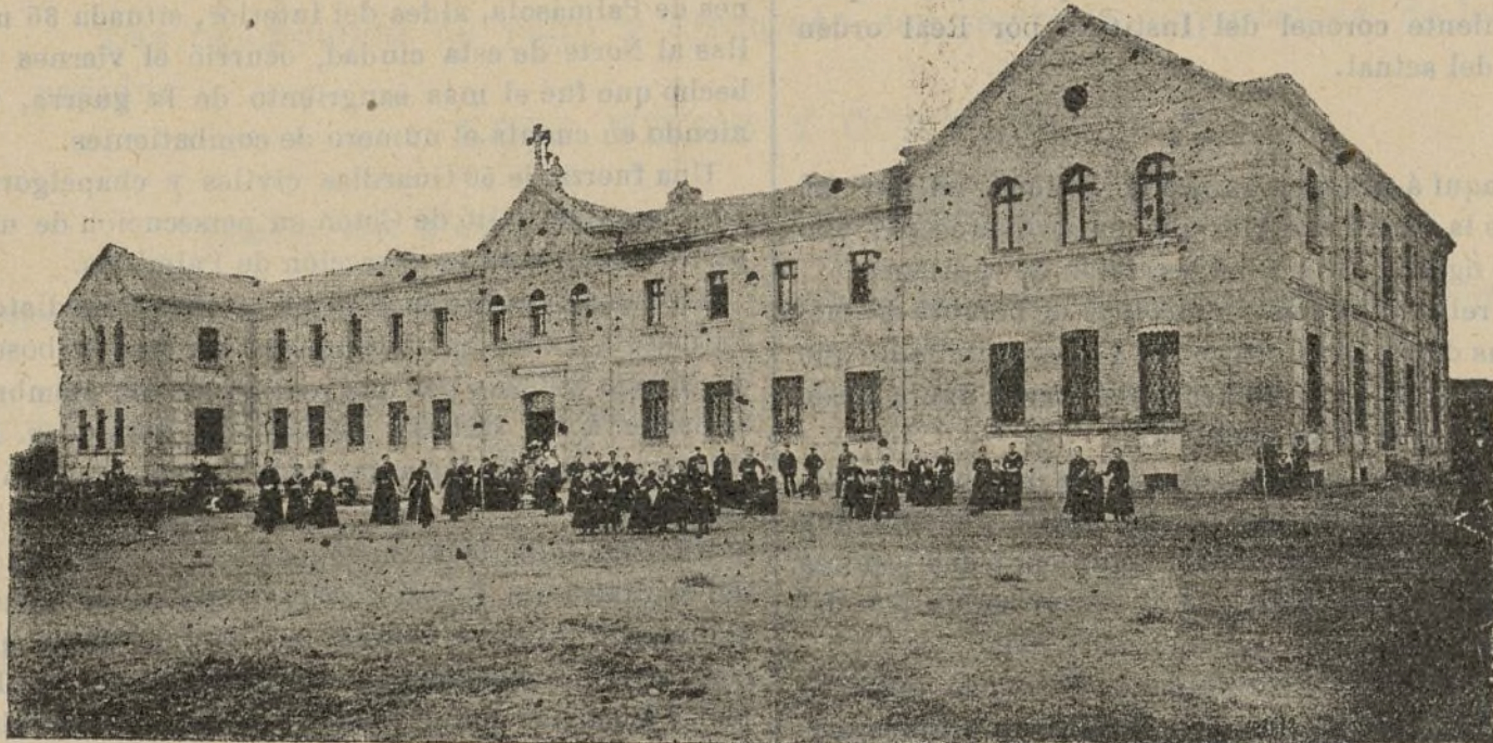
Asilo de niñas.

¡Lástima es, que al salir á los Tercios los que son