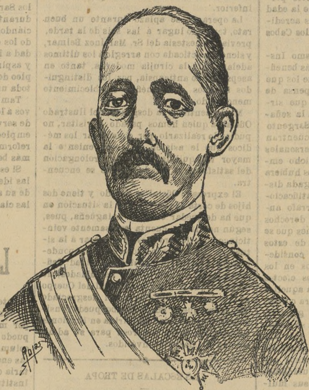
EXCMO. SR. D. MIGUEL CORREA MINISTRO DE LA GUERRA

Desde el día 2 del actual se encuentra enferma, habiendo llegado a la mayor gravedad, de la fiebre tifoidea, una hermana de nuestro colaborador Abate de Carlsol , el cual, desde los primeros momentos, se constituyó a la cabecera de la enferma, de donde no se ha separado aún, siendo esta la causa de que no haya continuado en los números anteriores de este periódico sus «Observaciones para un proyecto de reorganización de la Guardia civil».