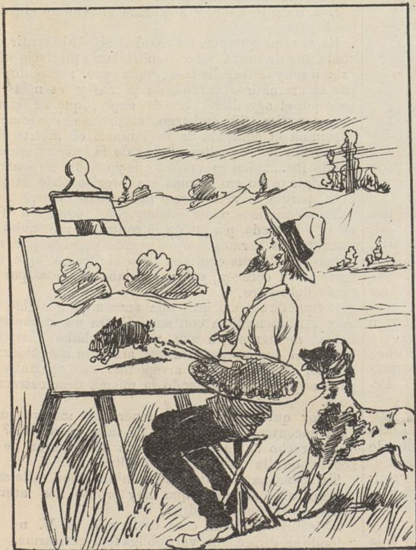
Parece una liebre de veras.