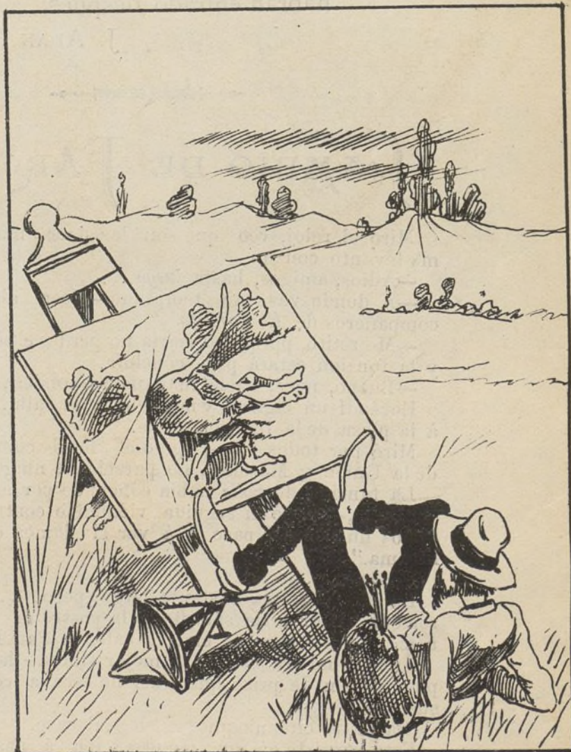
¡ Cuando decía yo que estaba muy natural !