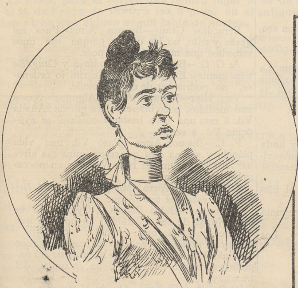
Paneracita, su linda y simpática hija.