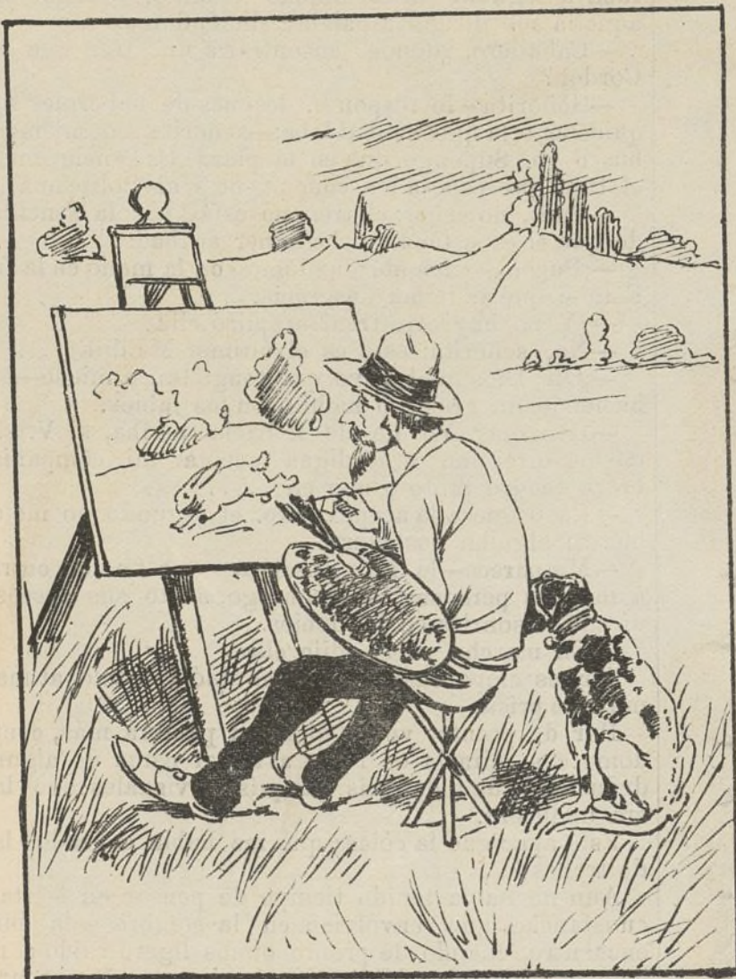
Le falta un toque.