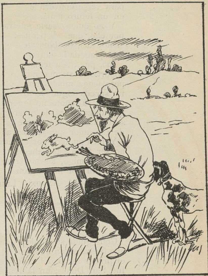
Esto está muy natural.