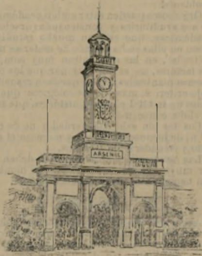
Puerta del Arsenal

Defendida por los elevados montes de Galera y San Julián, y resguardada por el islote Escombrarium , levántase Cartagena, su