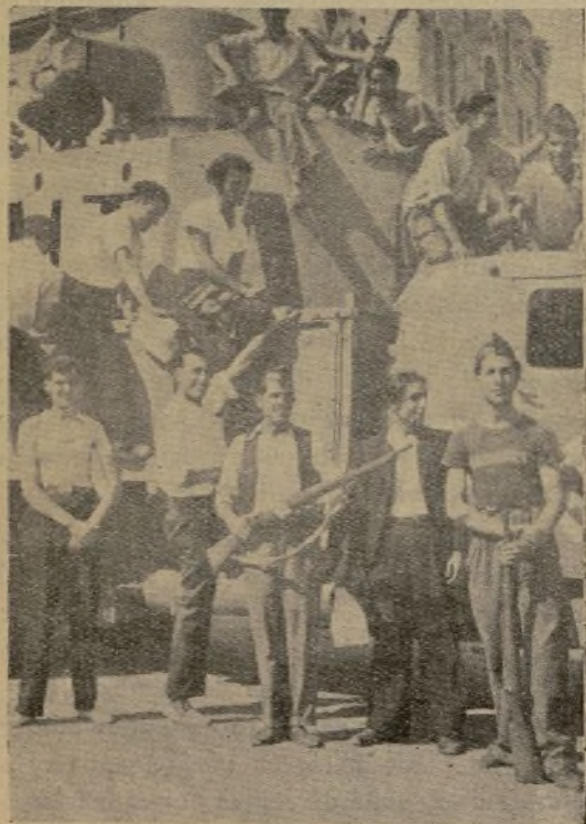
Uno de los coches blindados, dispuesto a salir para el frente

Si quieres clasificar la vida privada de un hombre, analiza su vida pública.