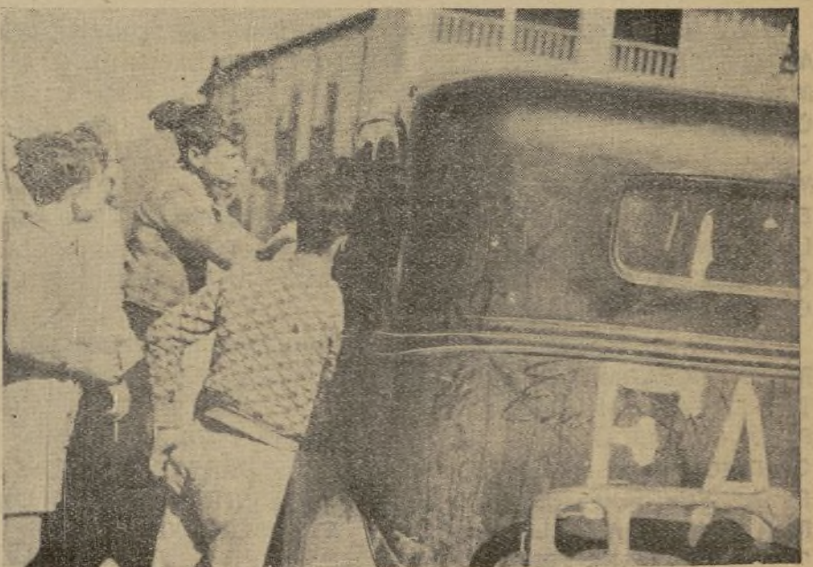
1. Grupo de milicianos mostrando algunos trofeos de guerra.—2. En un descanso nuestros combatientes leen con avidez la Prensa que se les envía.—3. Obreros agrícolas de la zona de guerra, después de recibir la Prensa libertaria.—4. La juventud de un pueblecito castellano del frente asalta alegremente nuestro coche en demanda de Prensa