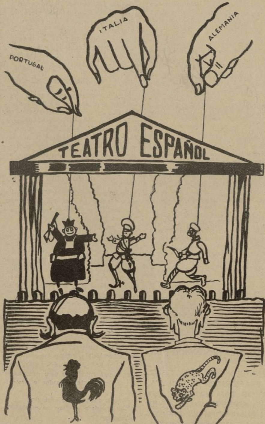
LOS QUE MUEVEN LOS MUÑECOS... Y LOS QUE HAN PAGADO PARA VERLOS MOVER

ASÍ, SÓLO ASÍ, LA VICTORIA SERÁ NUESTRA.