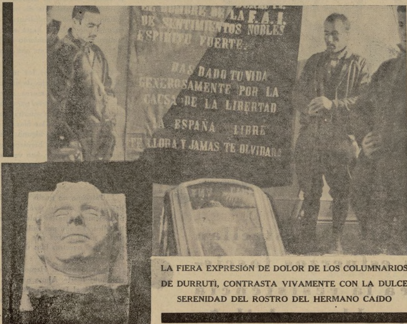
LA FIERA EXPRESIÓN DE DOLOR DE LOS COLUMNARIOS DE DURRUTI, CONTRASTA VIVAMENTE CON LA DULCE SERENIDAD DEL ROSTRO DEL HERMANO CAÍDO

Preguntamos... ¿es qué todavía se practica el adagio inmoral de que "quien no tiene padrino no se bautiza"?