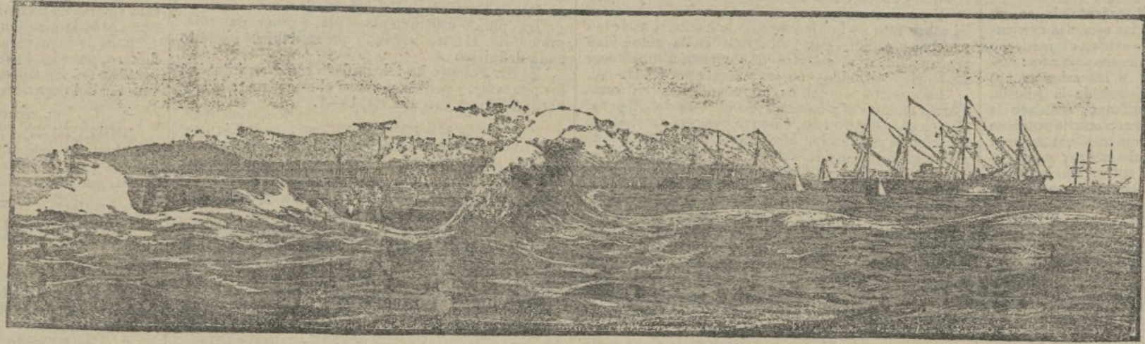
El Gymnote en el momento de sumergirse.

gó entre dos aguas, descendiendo hasta la profundidad de diez y seis metros.