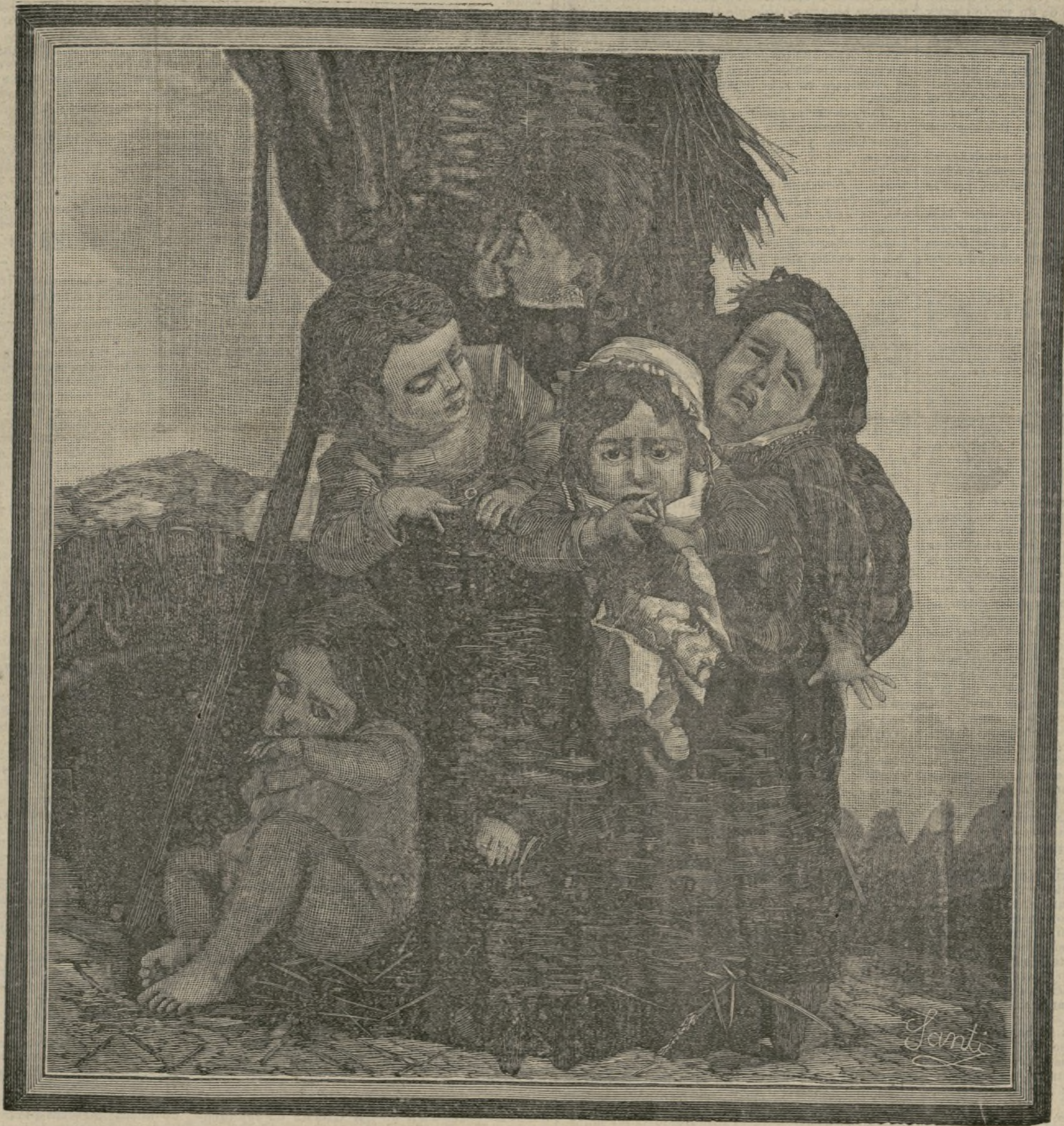
Una aventura infantil.

Cumplida esta obra de caridad, y después de sentir los ojos humedecidos por una saludable lágrima de misericordia, ya nos será a todos permitido adoptar, ante una superstición medio católica y medio pagana, la irónica sonrisa de Voltaire.