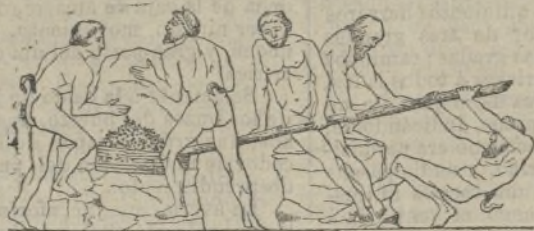
El vino entre los antiguos.

ver del capitán que mandaba la compañía asaltante, no dejara en tierra á los cuerpos fanáticos absolutistas. Perico tendió su vista á retaguardia, y al ver que su capitán iba á otro punto de la línea, animado con su ejemplo al soldado, corrió hacia él, le miró con ojos de profundo reconocimiento y siguió luchando hasta el fin de la jornada.