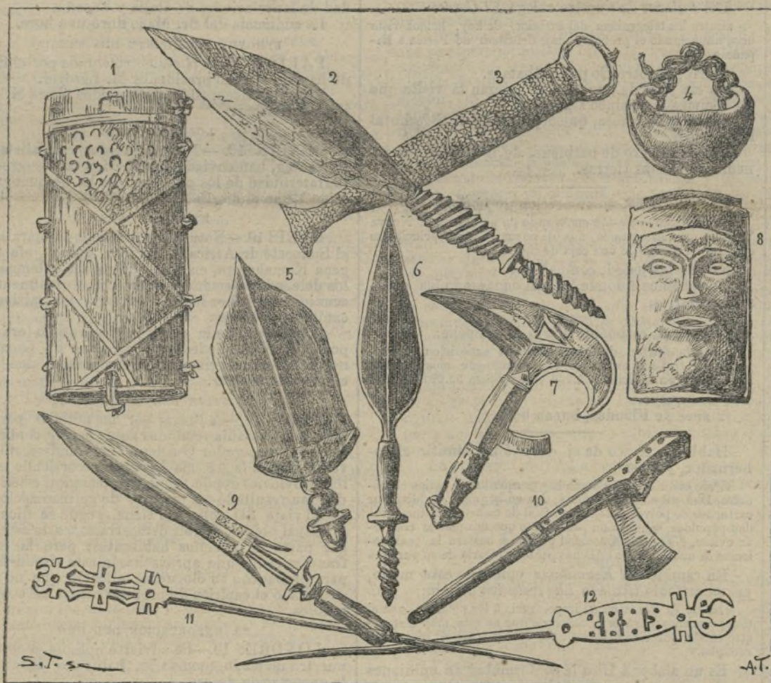
Armas del Africa Central.

Hay datos históricos de que á mediados del siglo XVIII espectáculos de ese género merecieron el favor del público de Florencia. Noticias posteriores dicen que D. Fernando, hermano de Felipe IV, los introdujo en nuestro país y construyó cerca del Buen Retiro un teatro destinado á ellos principalmente. Como ese teatro se levantó en un lugar campestre que por sus muchos zarzales era llamado la Zarzuela, la locución de «vamos á la zarzuela», hecha habitual en el público hizo pasar el nombre del sitio al espectáculo; y, finalmente con los adelantos de la ilustración, los especiales progresos de la literatura y de la música y las creaciones de compositores notables, pasó la zarzuela con sus elementos característicos al resto del mundo civilizado.