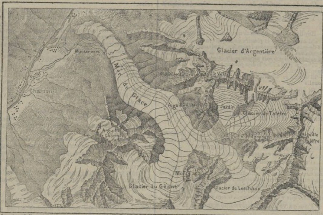
Carta de un mar de hielo en los Alpes

pues que hácia tí me atrae misteriosa ley natural, que el alma me fascina, cual si en tu mundo de diamante rosa continuara su vida voluptuosa el que al placer se inclina; déjame el aura, del amor en alas, de tus praderas respirar, floridas, y de poesía con divinas galas,