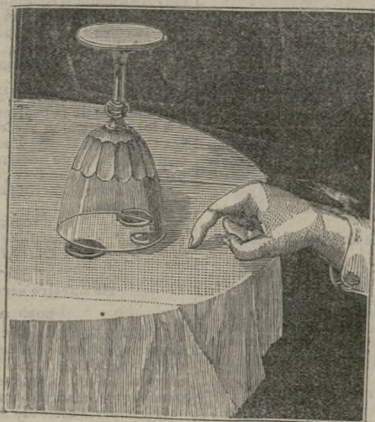
Elasticidad é inercia.

despacio habían de ir en creciente progresión para nombrarse primero magia, alquimia, astrología... y después, al pasar de los siglos, ciencias naturales.