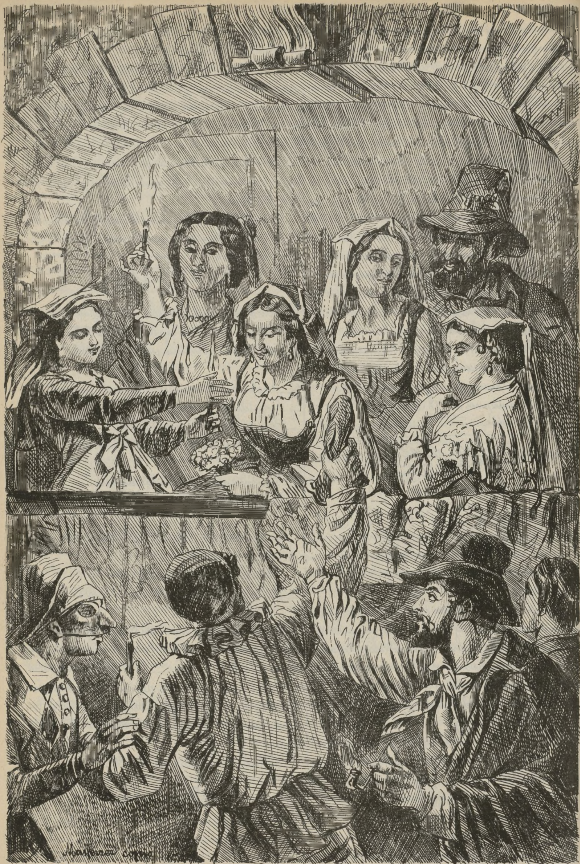
Bellas artes — Una escena del carnaval romano — Cuadro de M. Gierdziejewski —