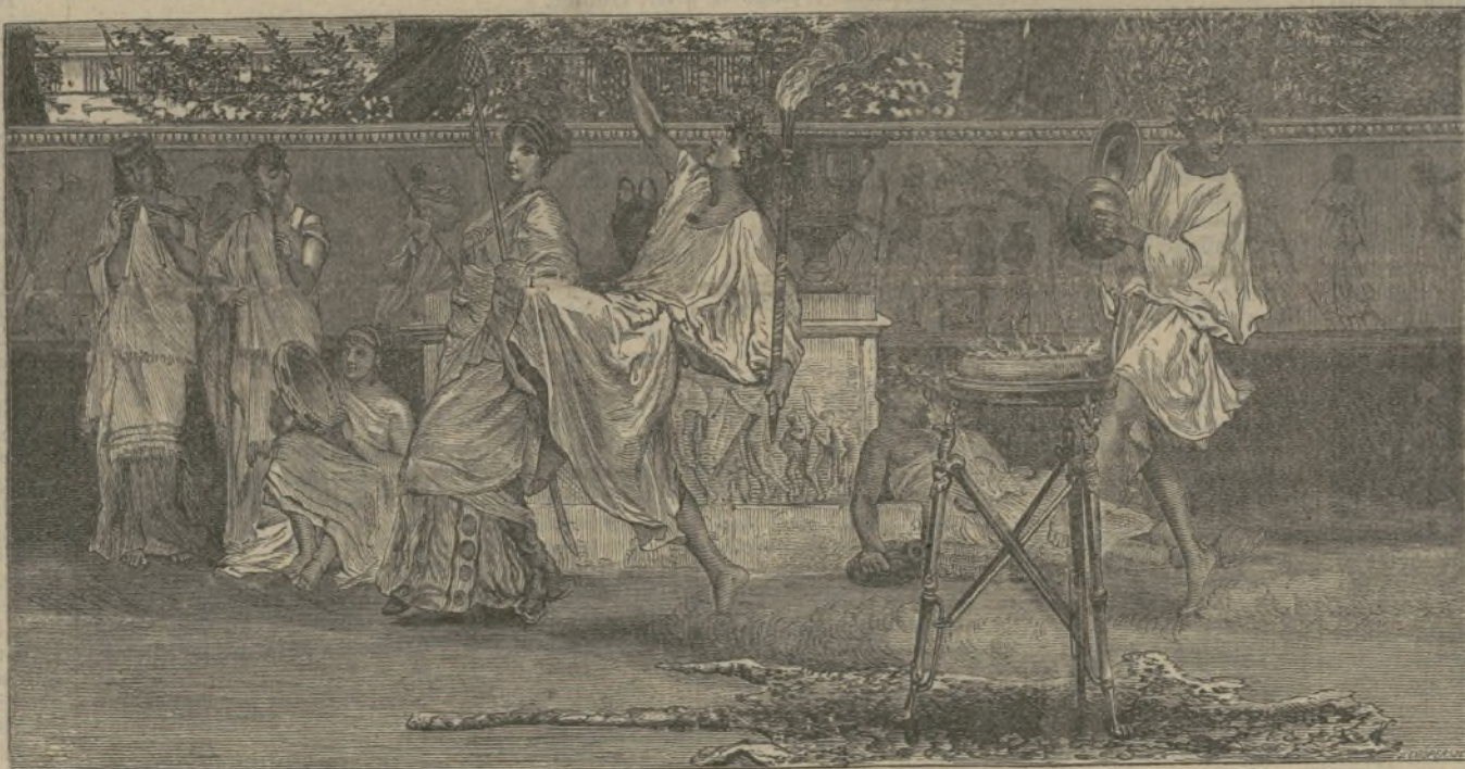
Una fiesta íntima. (Cuadro de Alma-Tadema.)

Es una interesante colección de cuadros de costumbres de aquel país, escrita con gran soltura por su novel autor.