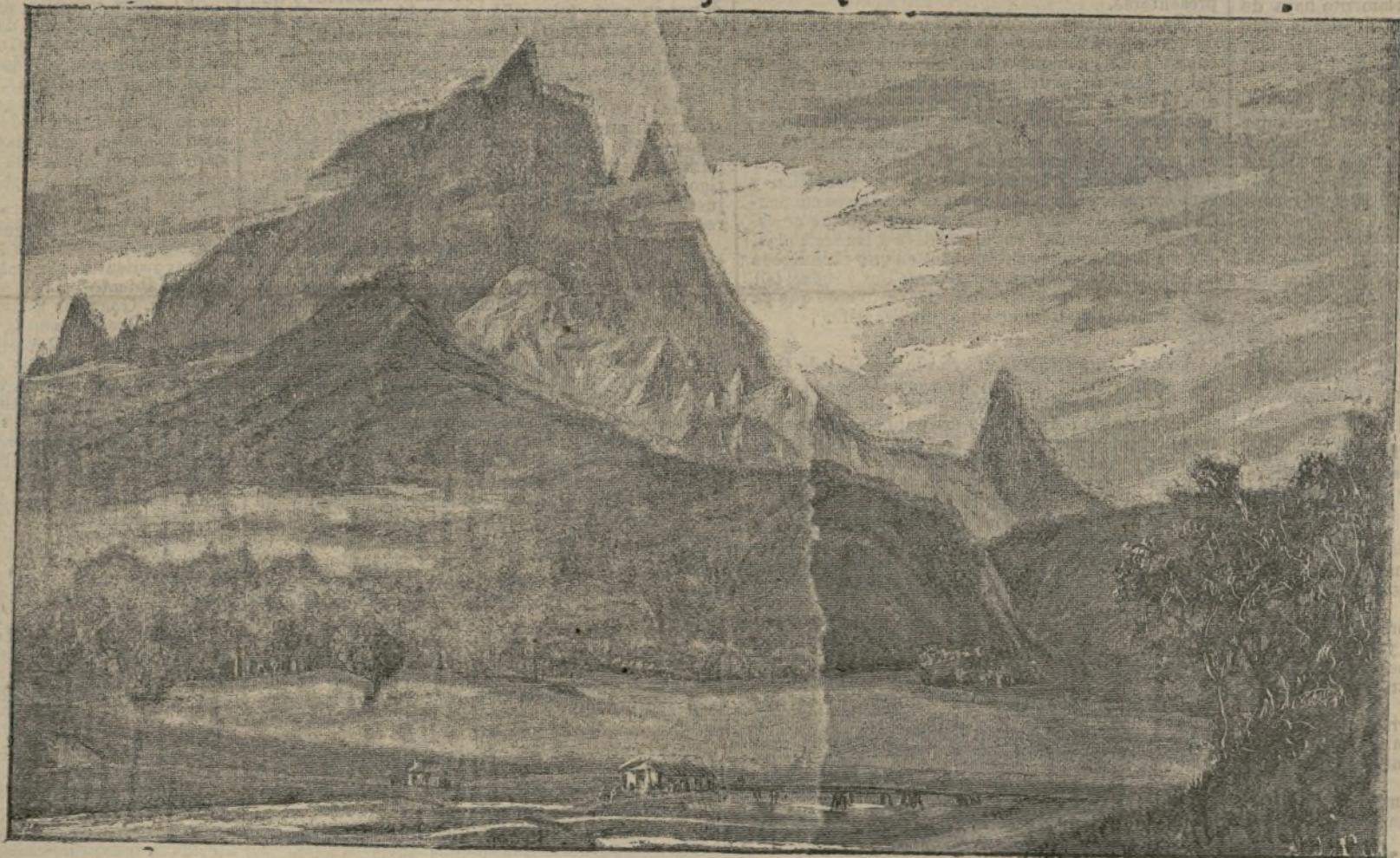
El pico Maledetta en los Pirineos.

El 23 fué el primer día de sesiones, las cuales deberán durar una semana, para tratar asuntos de la mayor importancia que se ligan con los intereses de la sociedad y muy particularmente con el sufragio de la mujer.