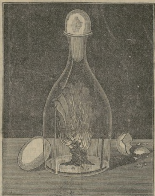
Entrada de un huevo en una botella.

Libra ó la Balanza. Al Este de la Espiga de Virgo se ven dos estrellas de segunda magnitud que marcan el vértice de los platillos.