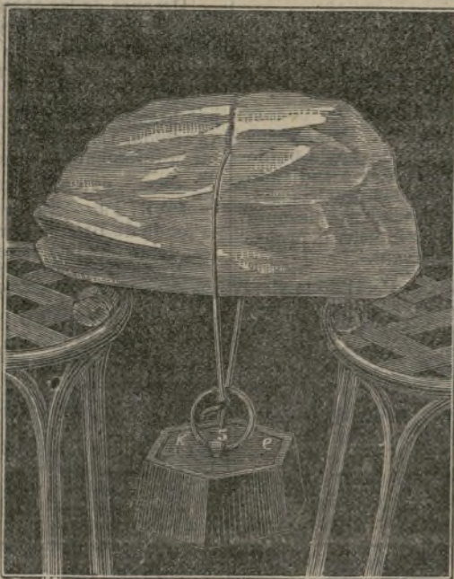
Fenómenos del calórico.

El palacio parece una ascua de oro; por sus anchas ventanas, abiertas, se ven los salones llenos de luz, que reflejan hasta el infinito, grandes espejos