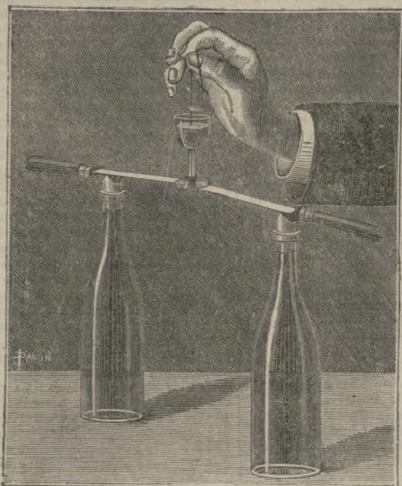
El vaso marioneta.

ción no ha aumentado mas que un 14 por 100, el consumo del alcohol ha aumentado un 37 por 100 y con él han aumentado: