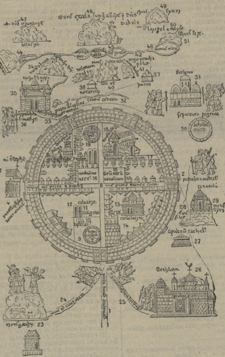
Plano de Jerusalem en el siglo XII

En mi vida he sufrido desilusión más completa. No sentí devoción, sino indignación profunda. ¡Cuánto más valían las Pirámides y el Cairo! ¡Cuánto más Jaffa y Ramleh! Cualquier cosa. Pocas en mi vida me han producido peor efecto. No quise mirar más; y con negro humor me embutí en mi rincón del vehículo, del que me removieron los carabineros, metiendo sus narices por entre las cortinas para olfatear nuestros equipajes y hacernos entregar vellis nolis los pasaportes.