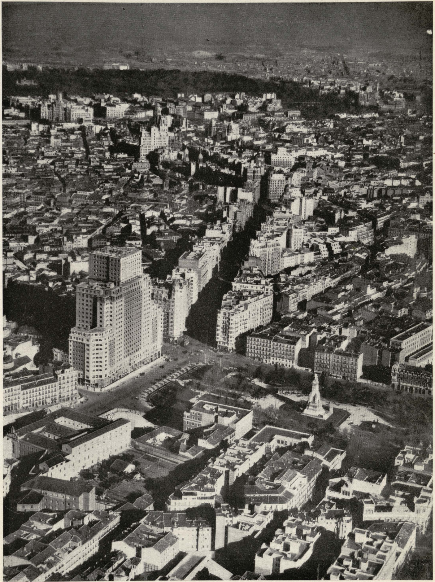
Plaza de España y Avenida de José Antonio.