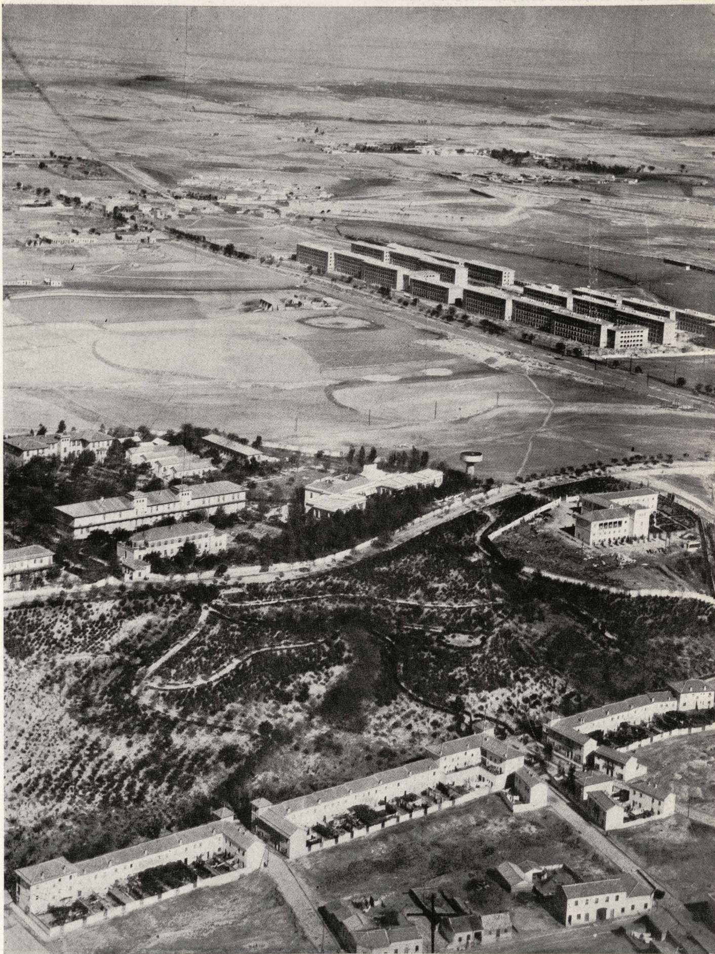
Nuevo parque de la Ventilla, que limita la barriada por el Norte.