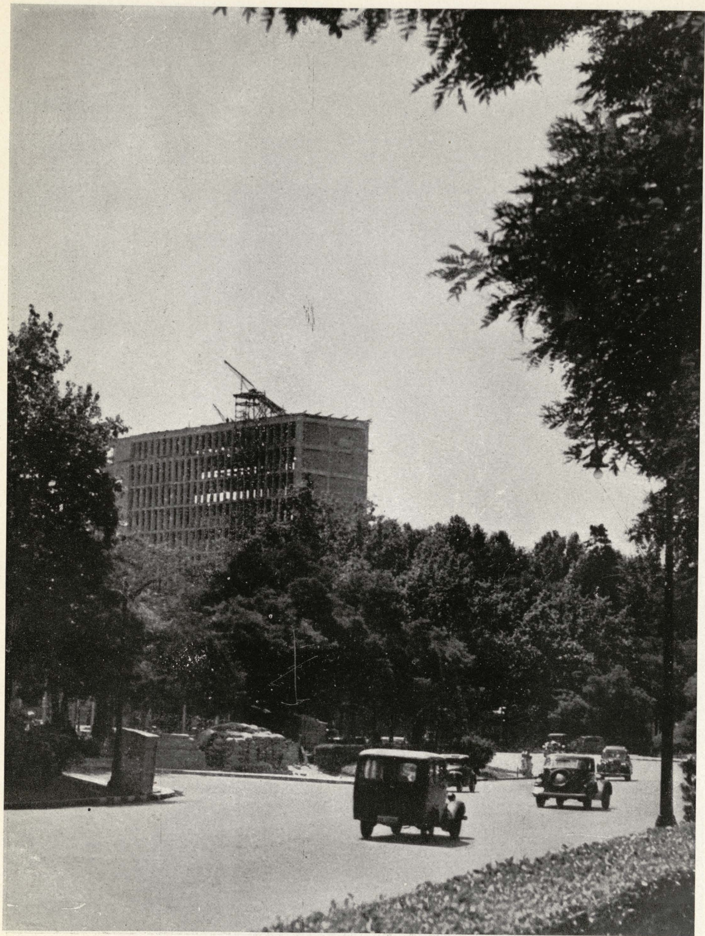
Aspecto del edificio en construcción para la Embajada de los Estados Unidos, desde el Paseo de la Castellana.