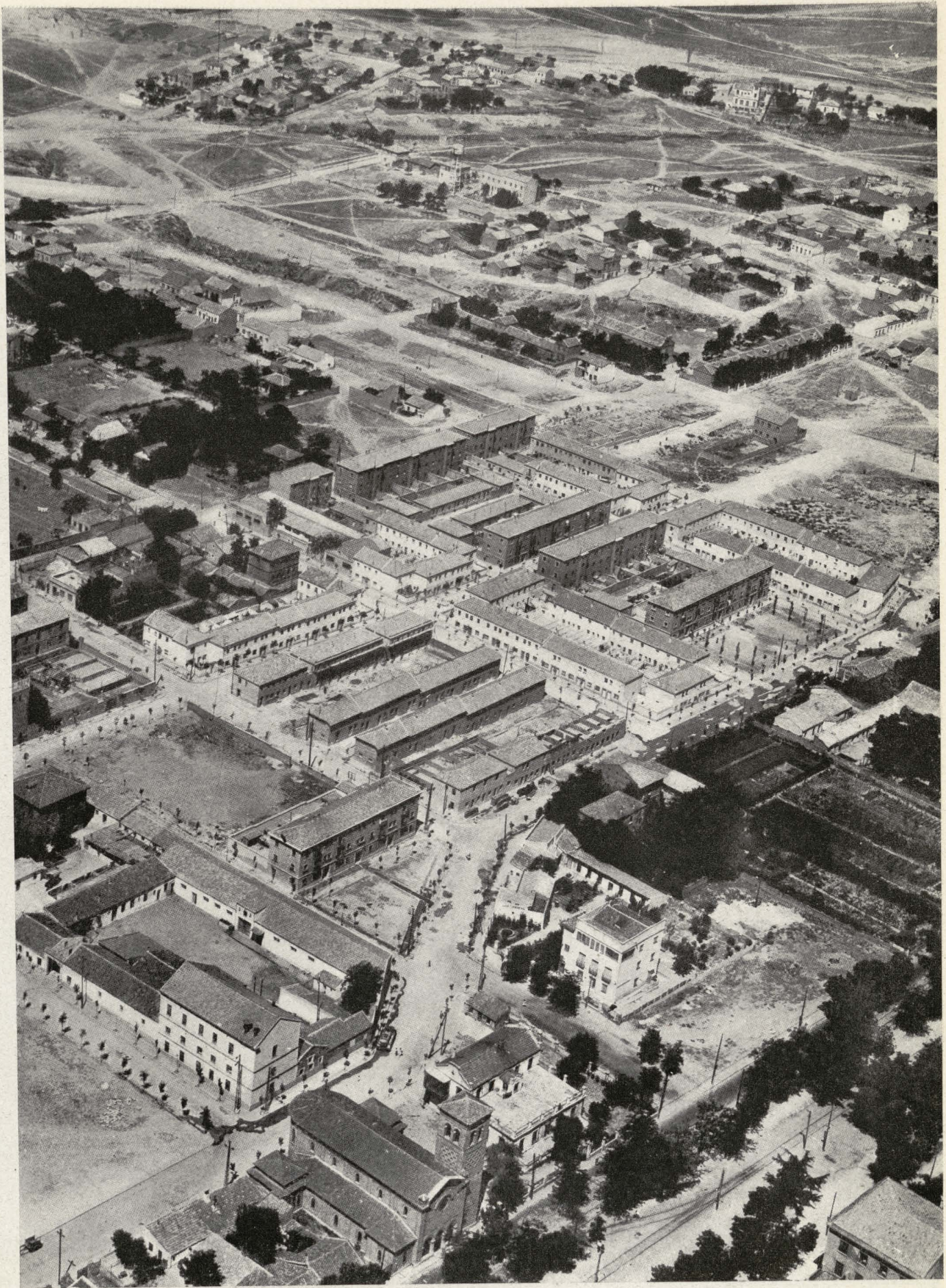
Bloques de viviendas construidos en la barriada de Pueblo Nuevo.