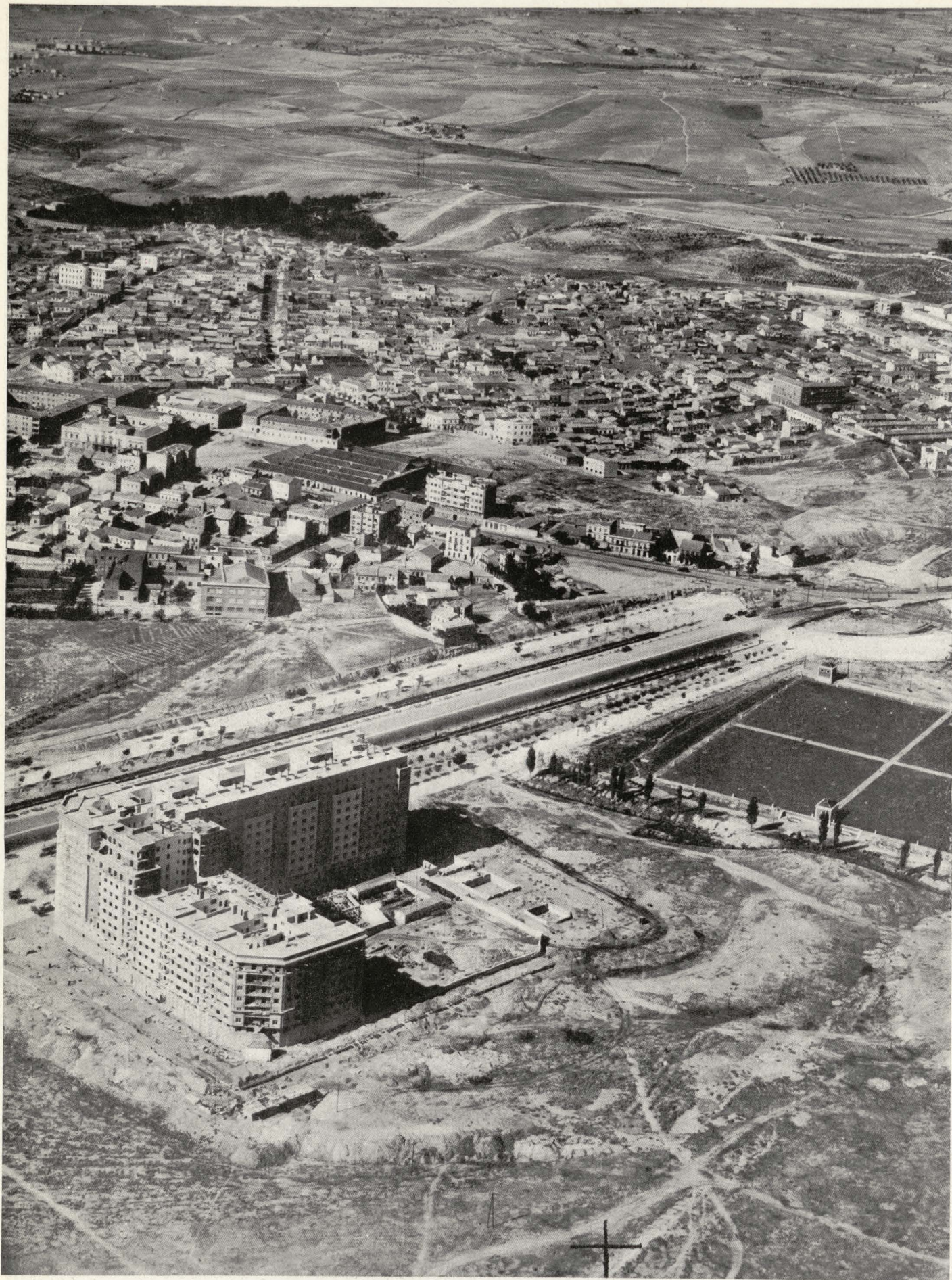
Manzana de casas en construcción al final de la Avenida del Generalísimo.