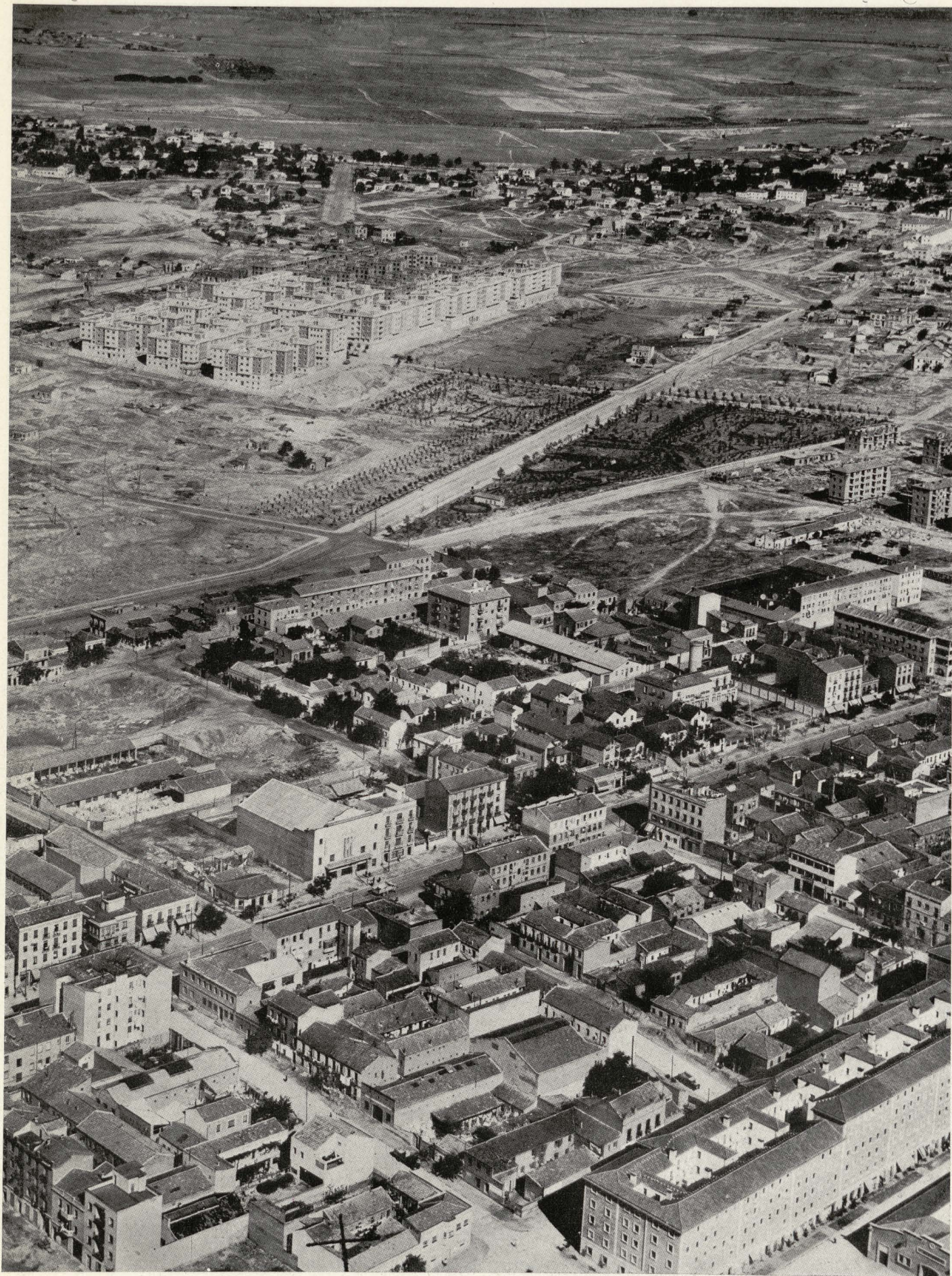
Parque del Calero y nuevos edificios en este sector.