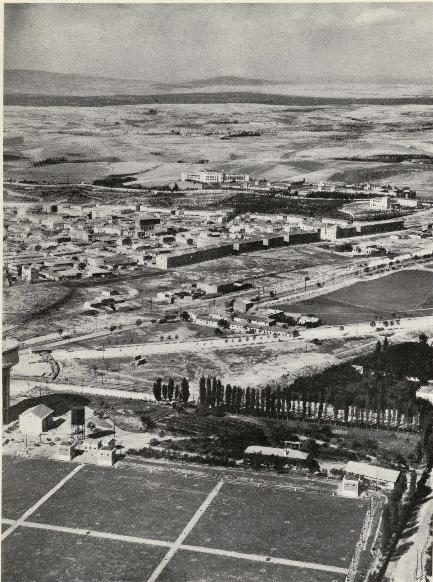
Autopista de acceso en construcción de la carretera de Francia por Irún y suburbio de la Ventilla.