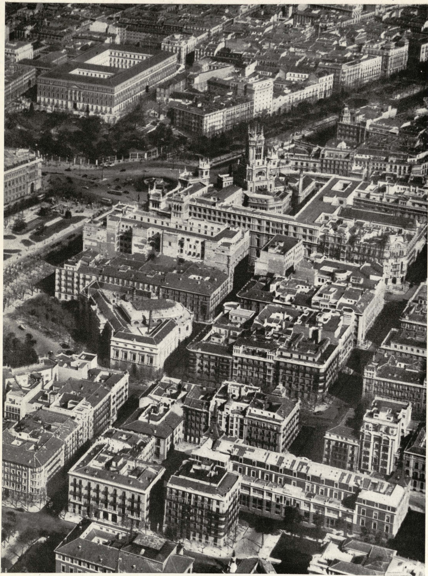
Plaza de la Cibeles.