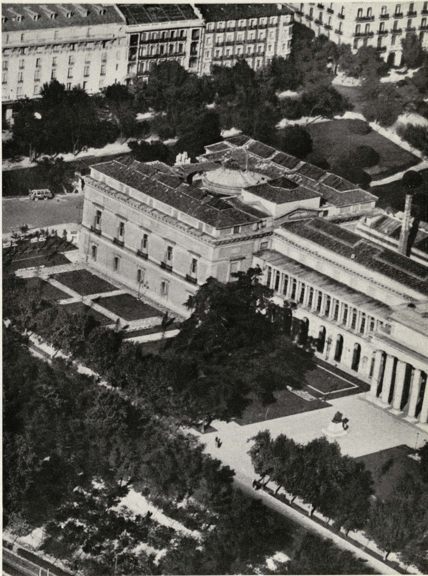
Museo del Prado.