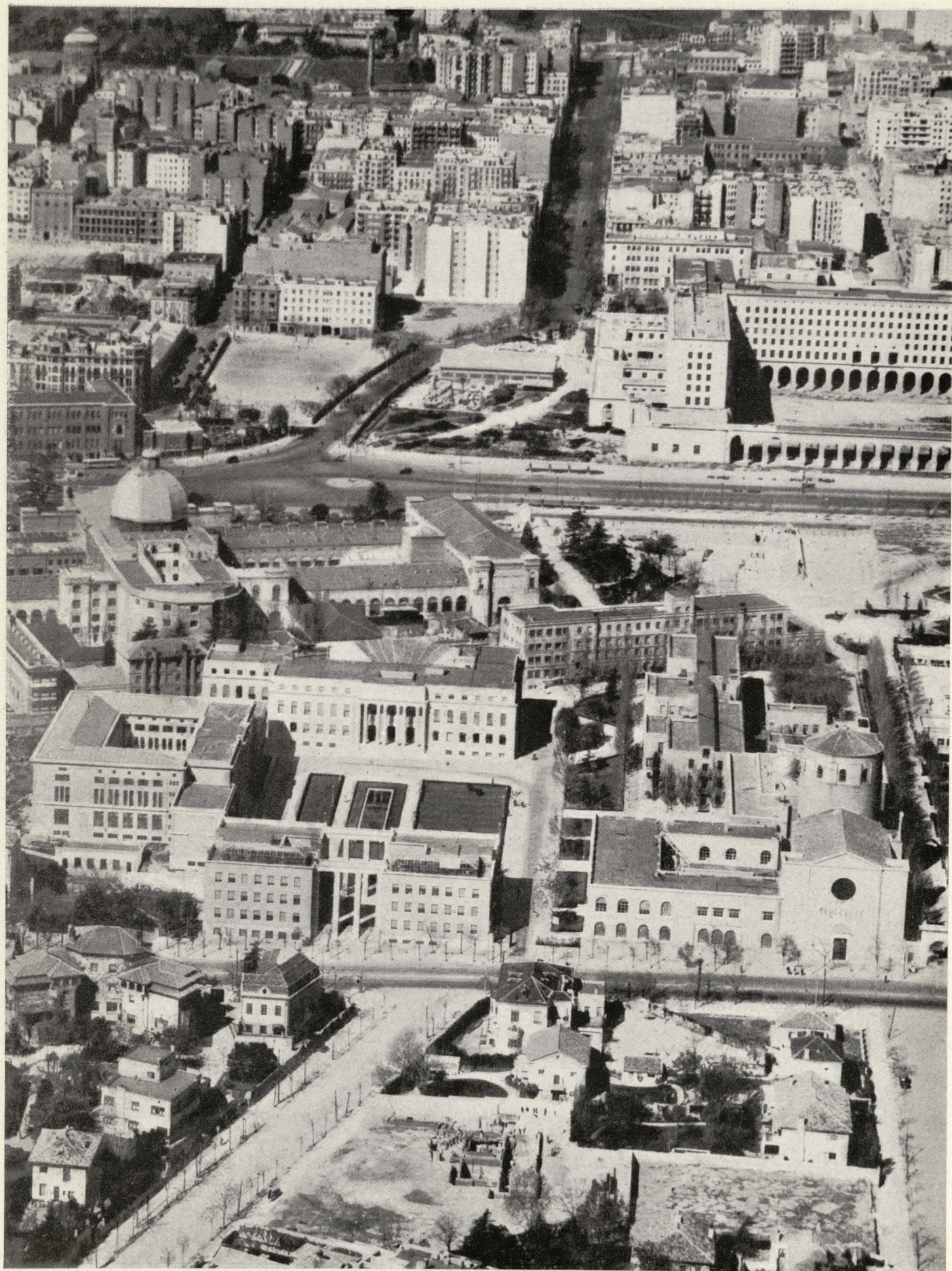
Grupo de edificios del Instituto Nacional de Investigaciones Científicas en la calle de Serrano.