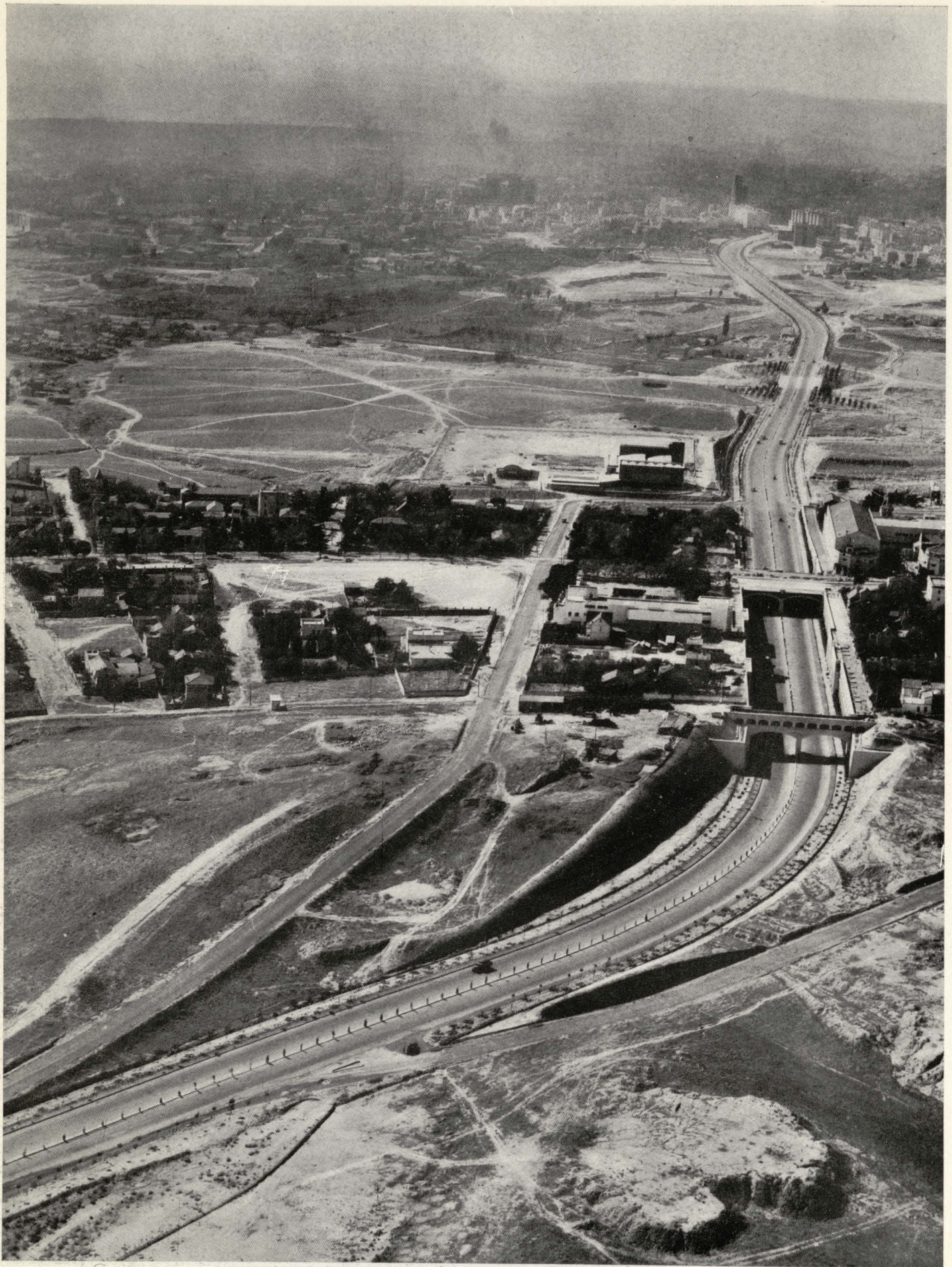
Cruce de la autopista de Barajas con la Ciudad Lineal.