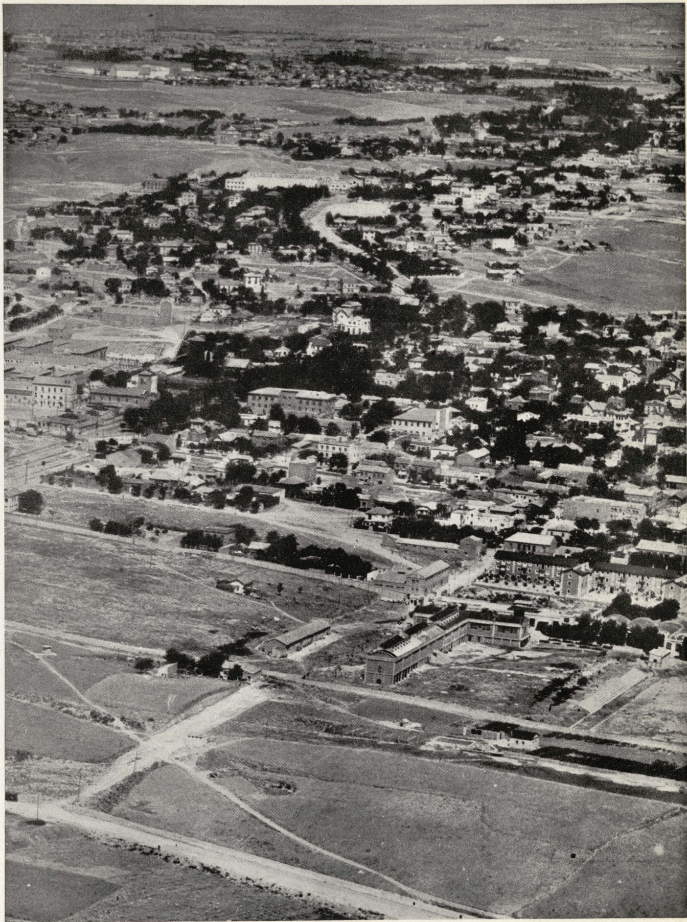
Nueva urbanización de la zona industrial de Canillejas.