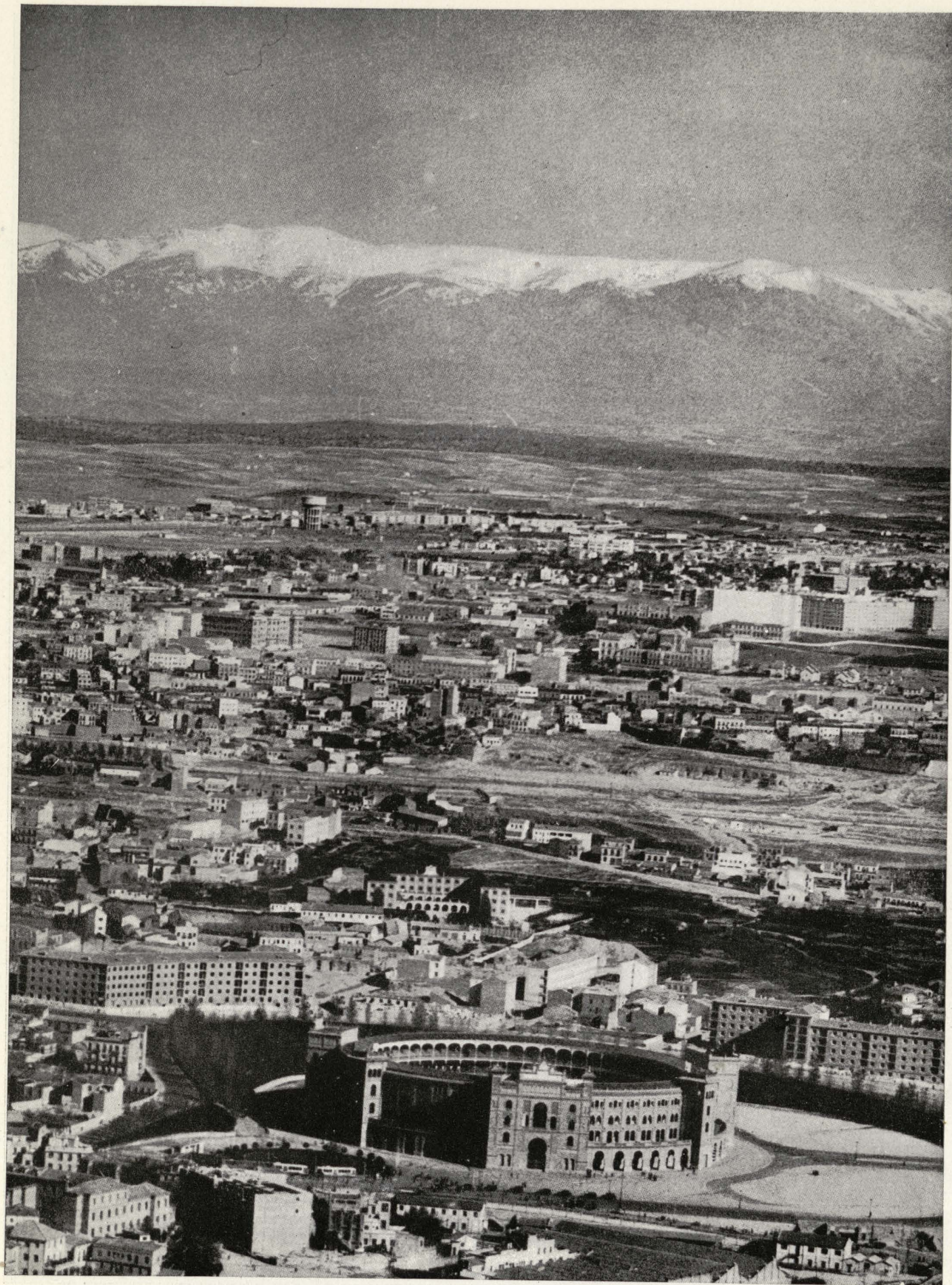
Plaza de Toros.