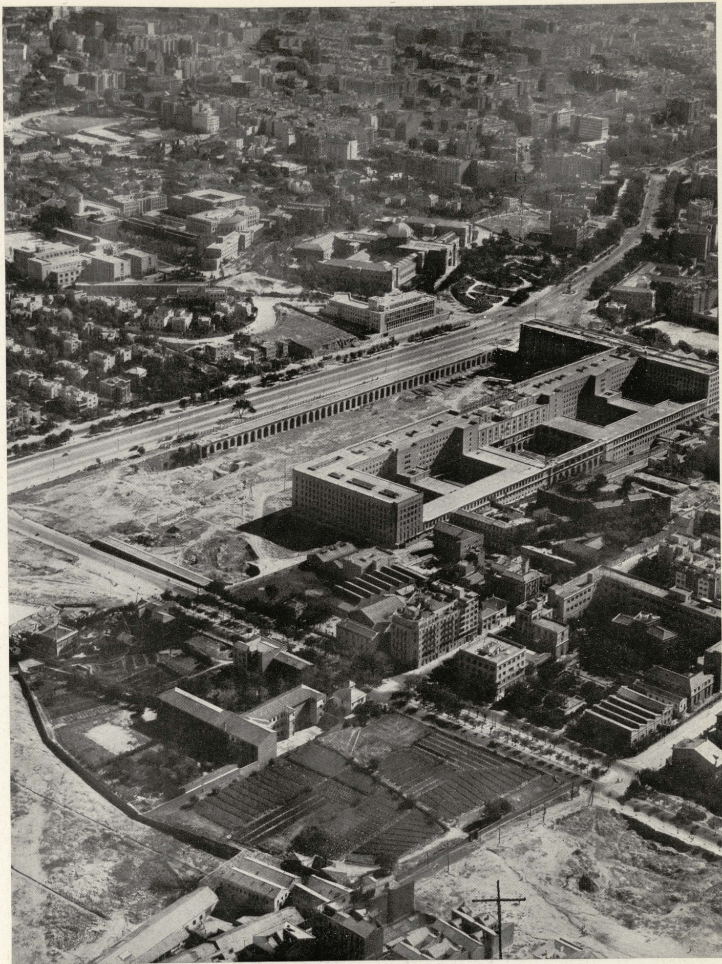
Edificio en construcción de los Nuevos Ministerios.