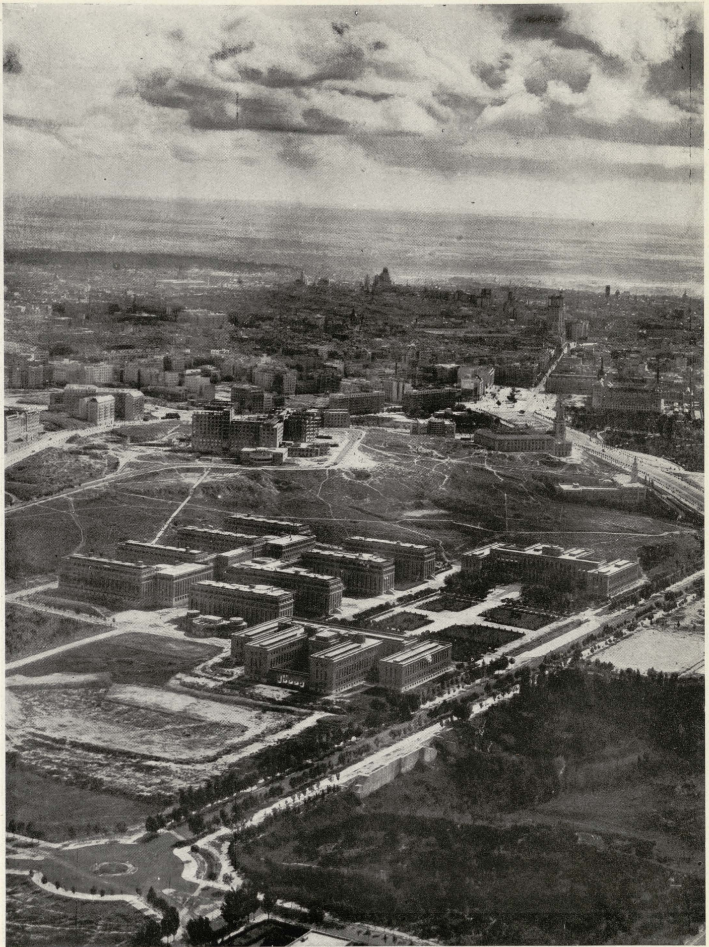
Aspecto parcial de la Ciudad Universitaria.