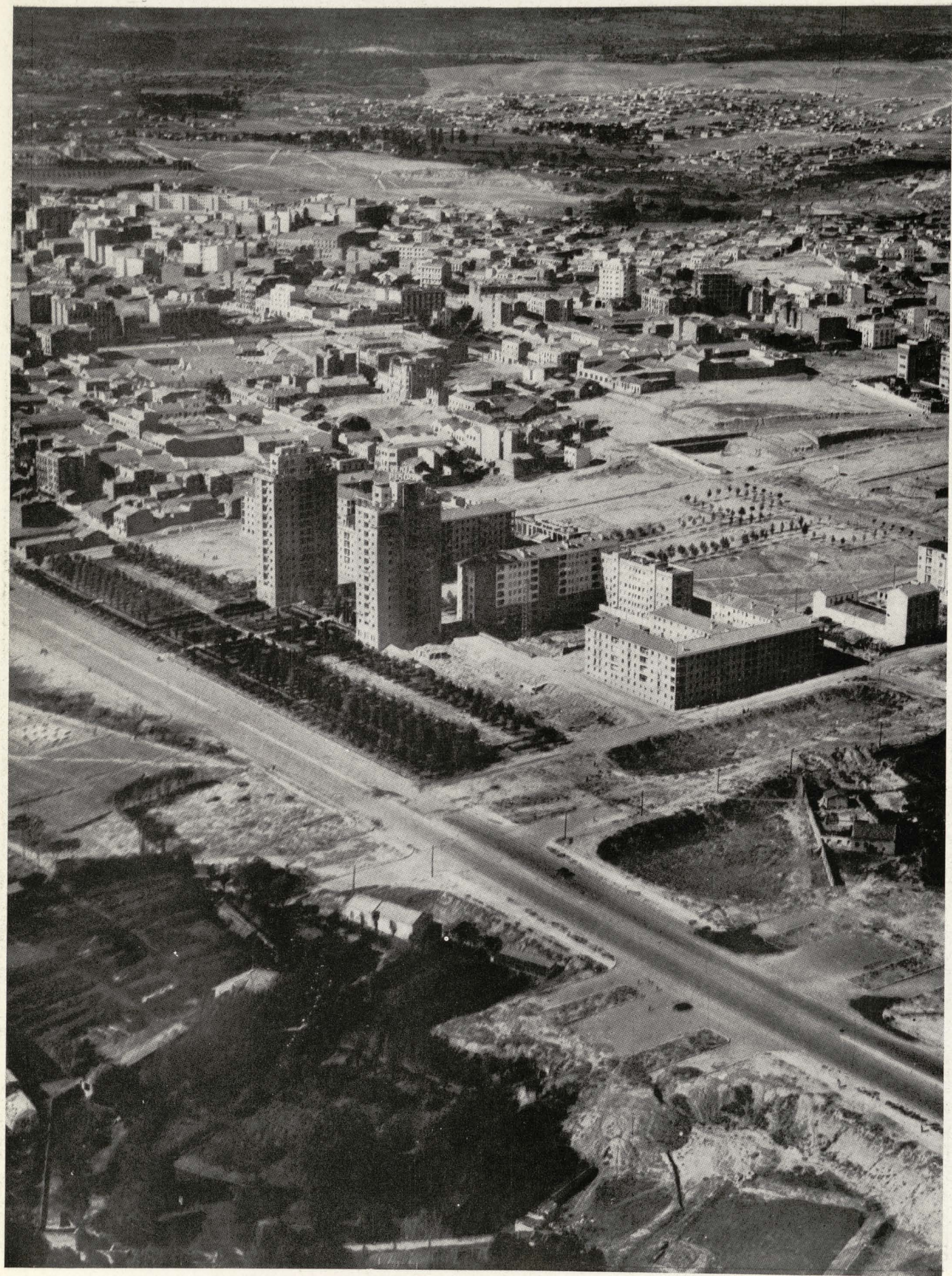
Jardines de la Avenida del General Perón y nuevas edificaciones del Sector NE. de Cuatro Caminos.