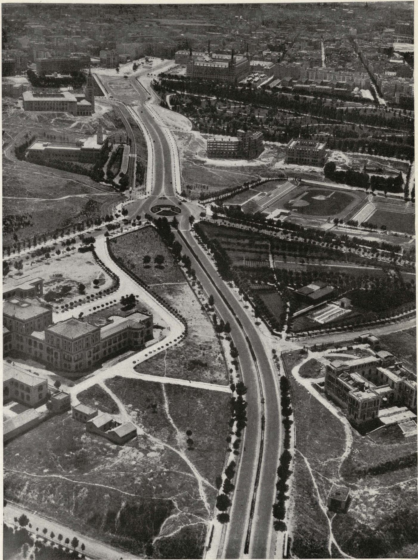
Autopista de acceso desde la carretera de La Coruña a través de la Ciudad Universitaria.