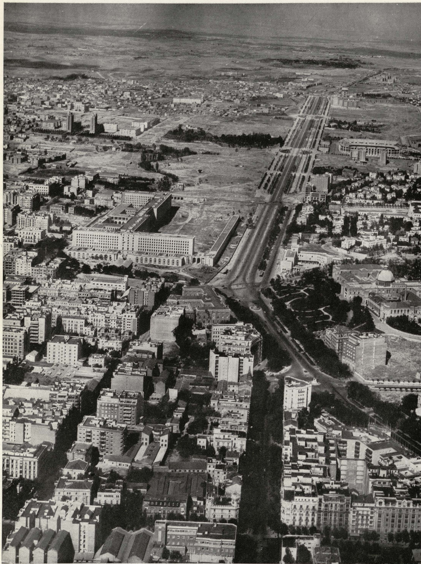
Avenida del Generalísimo y final del Paseo de la Castellana.