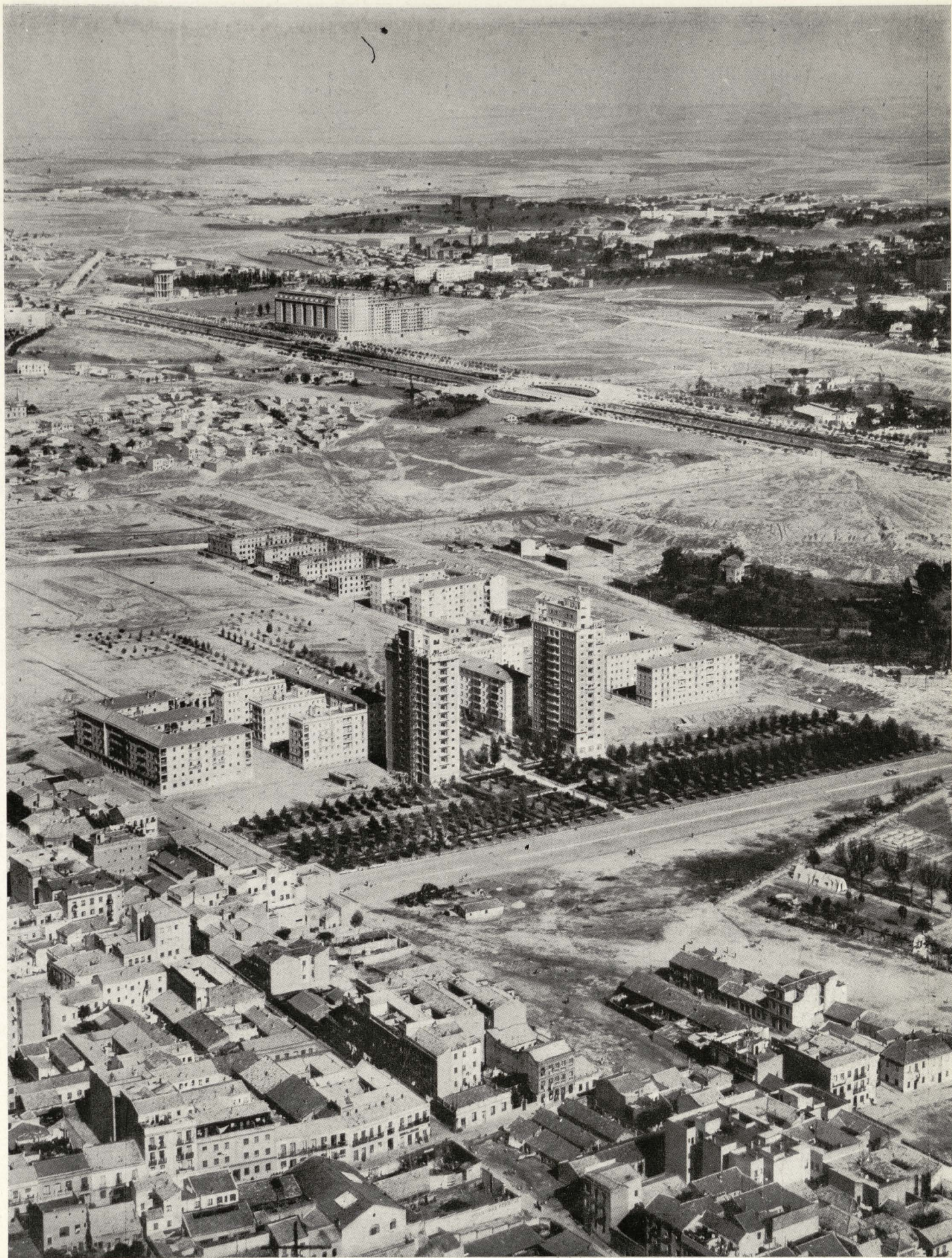
Avenida del General Perón entre el suburbio de Cuatro Caminos y la Avenida del Generalísimo.