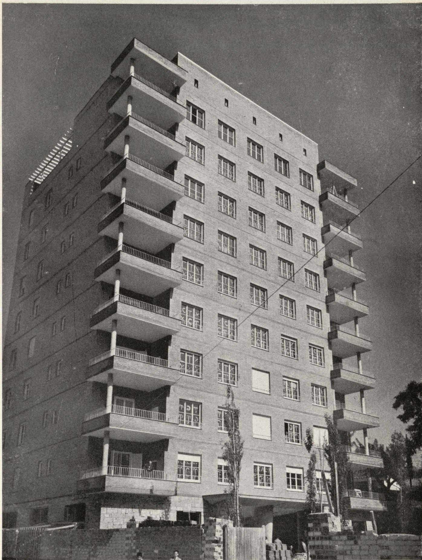
Casa de vecindad en la calle de Cea Bermúdez.