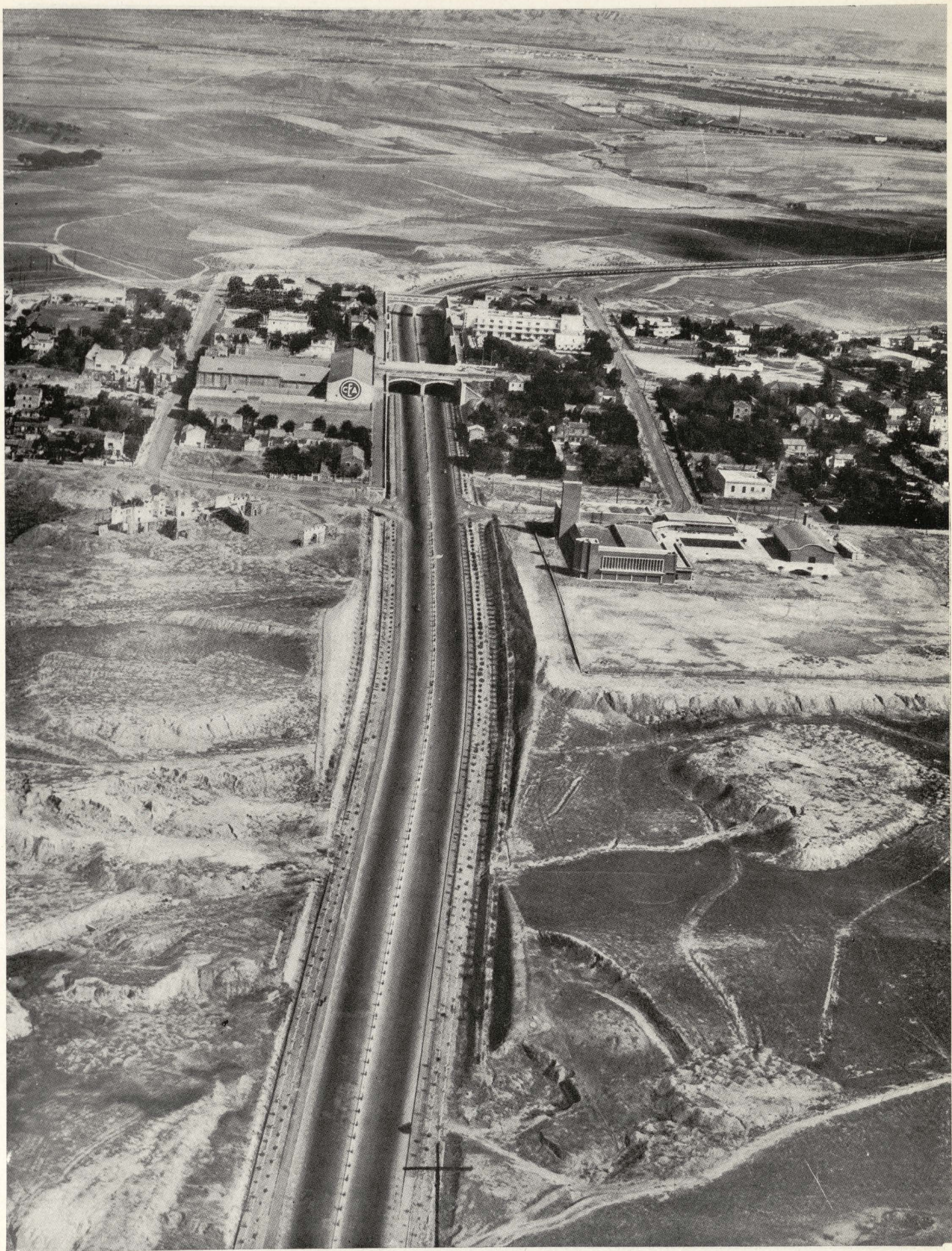
Cruce de la autopista de Barajas con la calle de Arturo Soria.