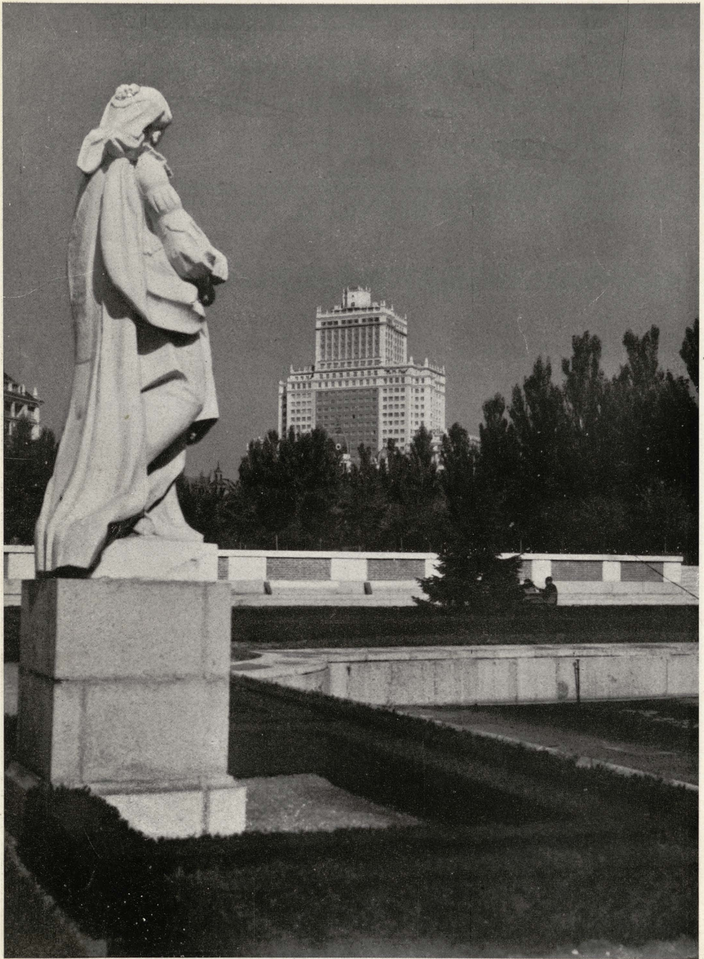
Edificio "España", con los jardines de Sabatini en primer término.