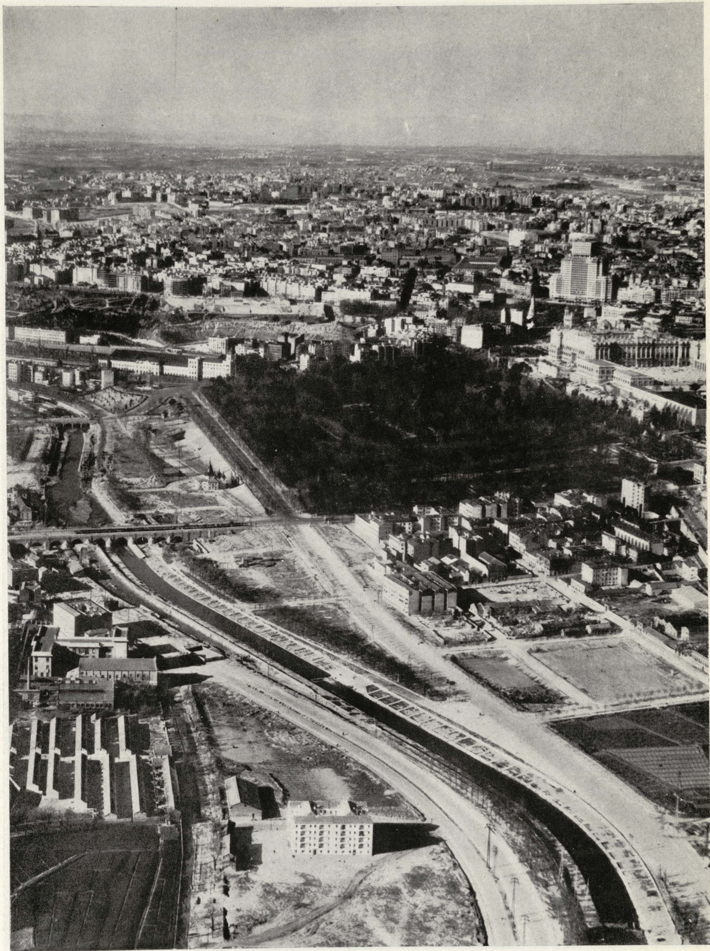
Jardines del Campo del Moro y puente de Segovia sobre el río Manzanares.