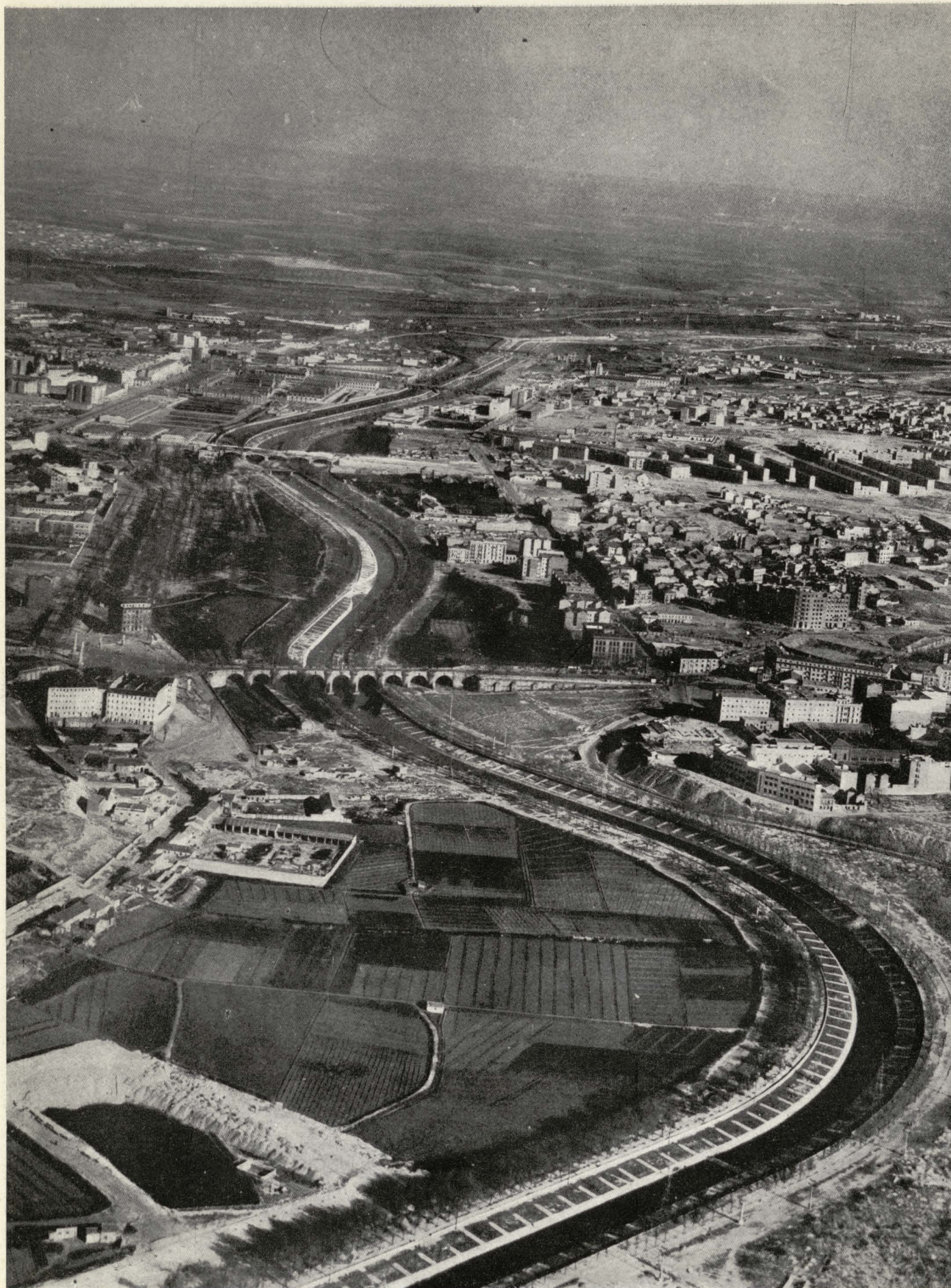
Aspecto de conjunto del rio Manzanar en su parte canalizada.