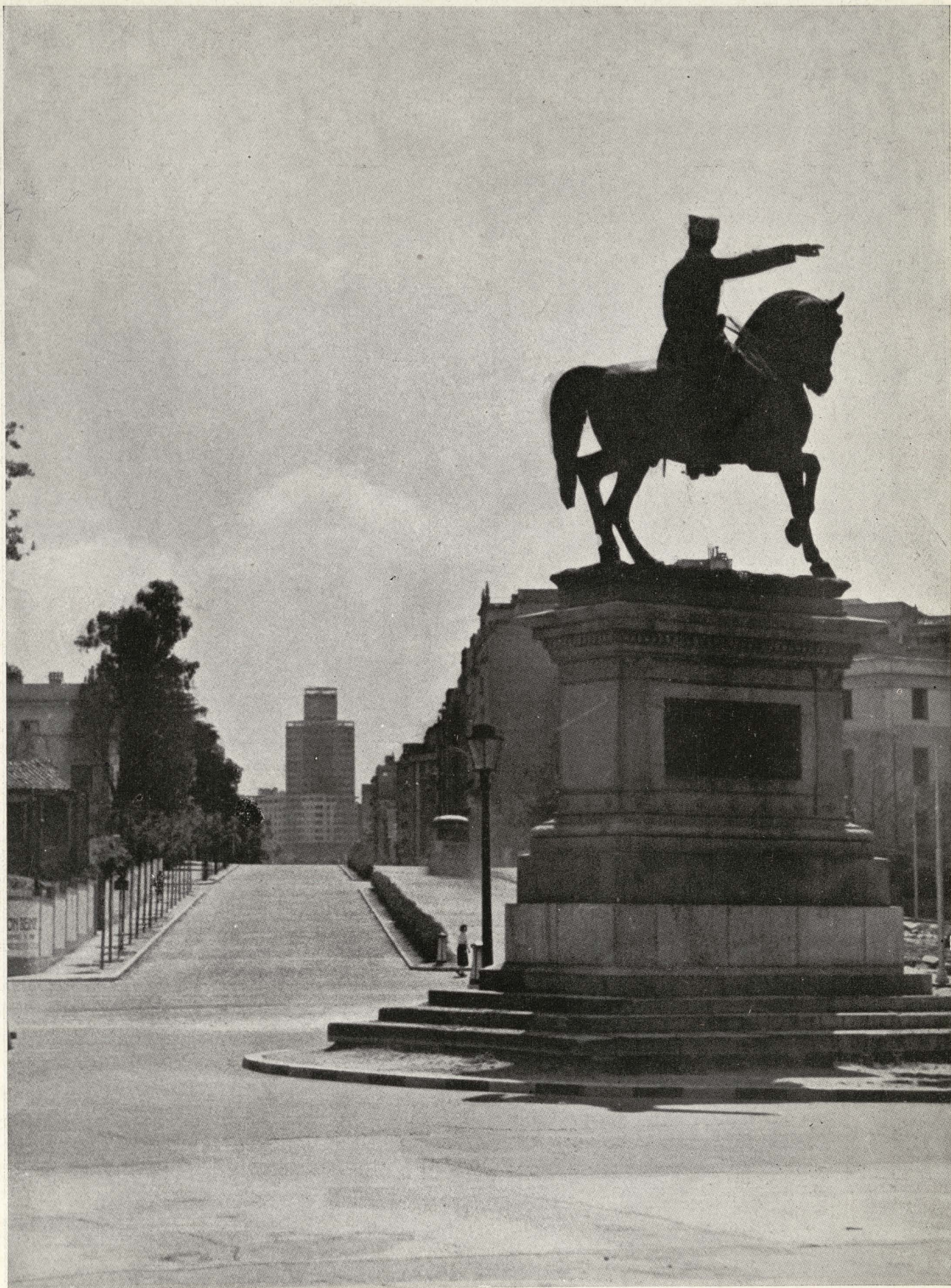
Iniciación de la calle de María de Molina desde el Paseo de la Castellana. Al fondo, el rascacielos de la autopista de Barajas.