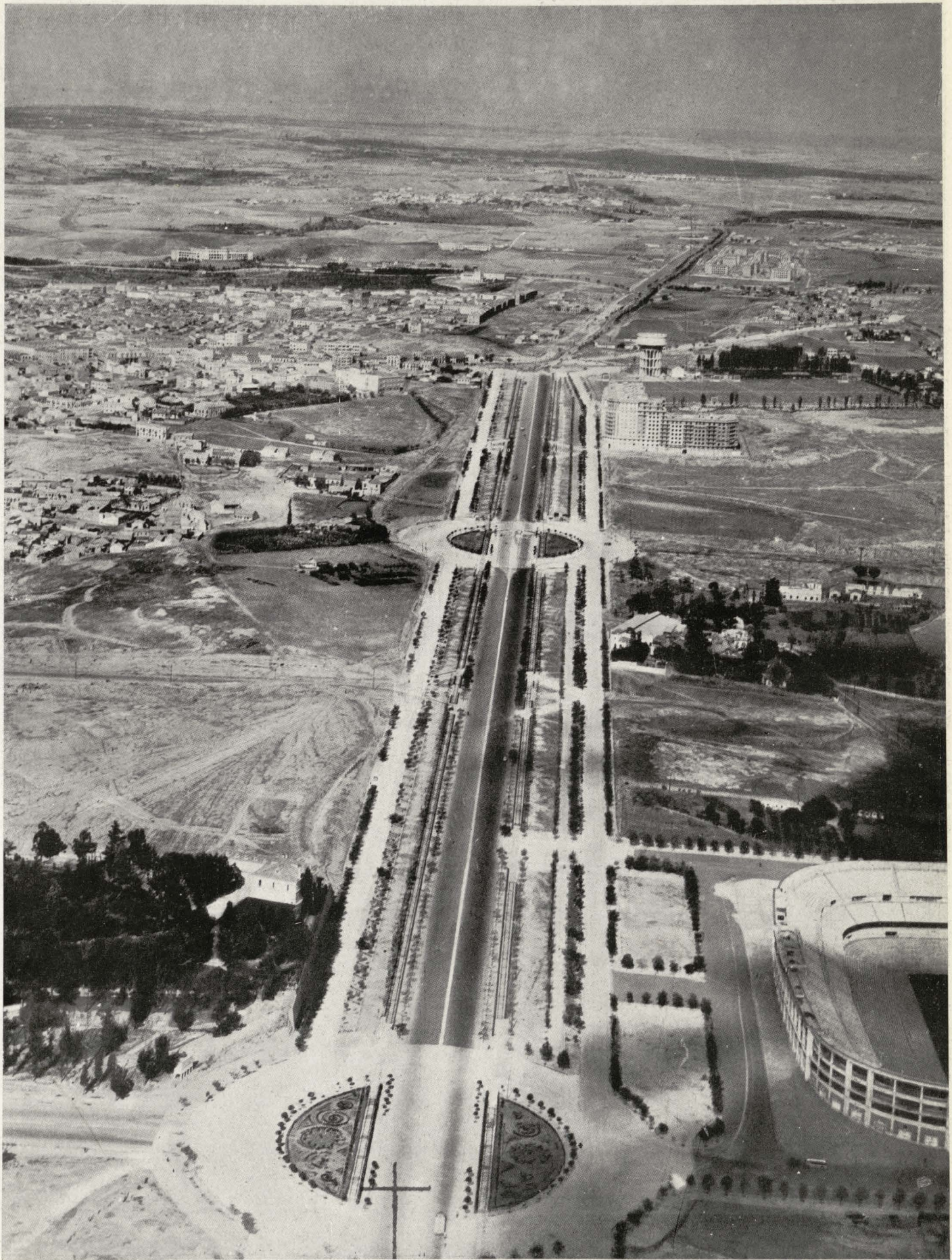
Avenida del Generalísimo desde la Avenida del General Perón hasta la Plaza de Castilla.