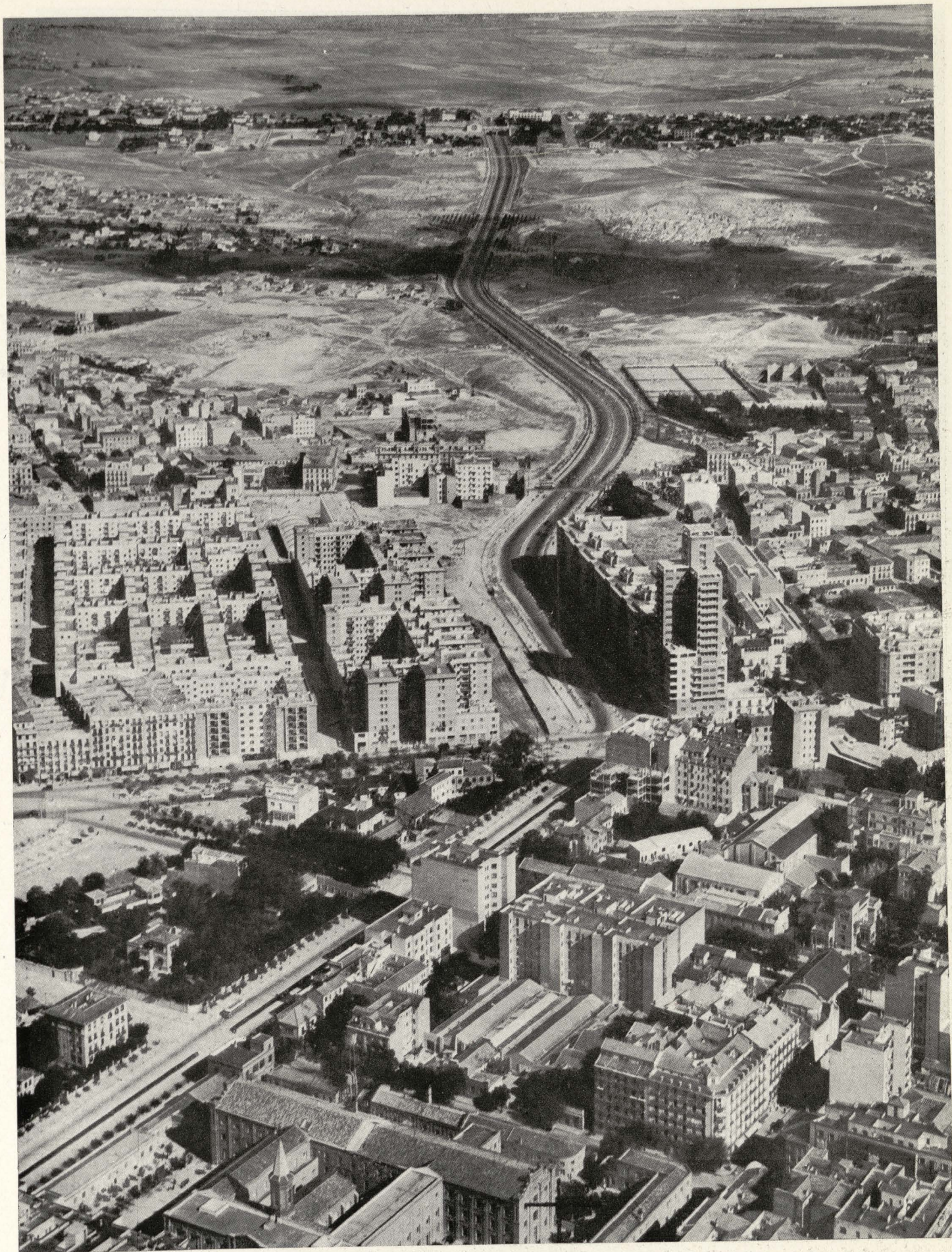
Acceso del aeropuerto de Barajas y calle de María de Molina.