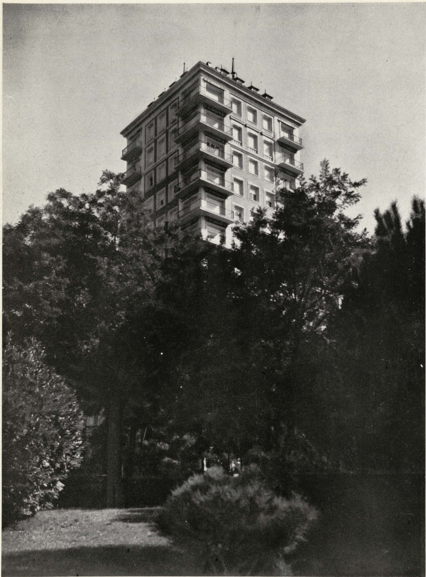
Perspectiva desde el parque del Oeste de la casa de nueva construcción en el Paseo de Rosales, esquina al Paseo de Moret.