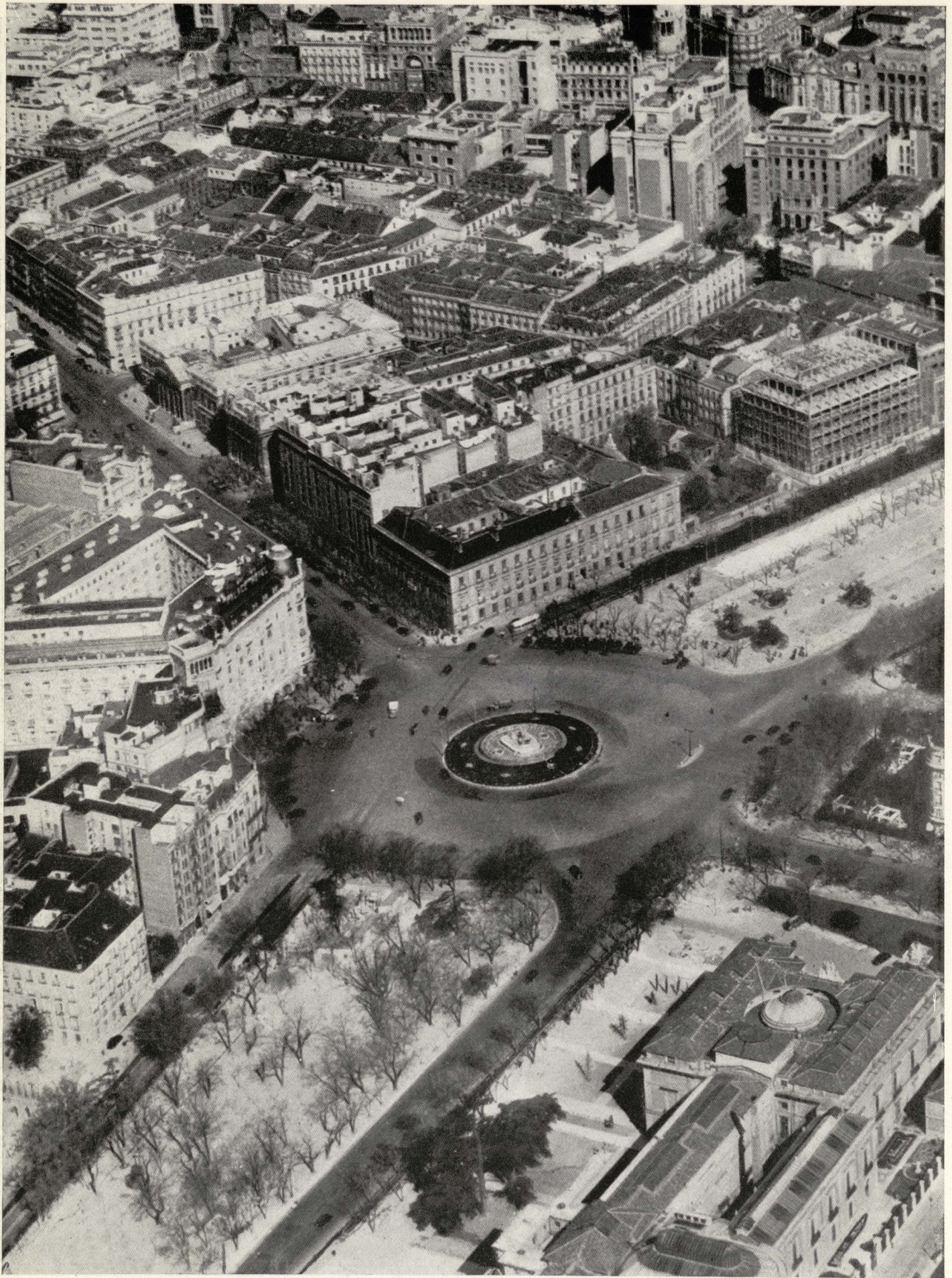
Plaza de Neptuno.