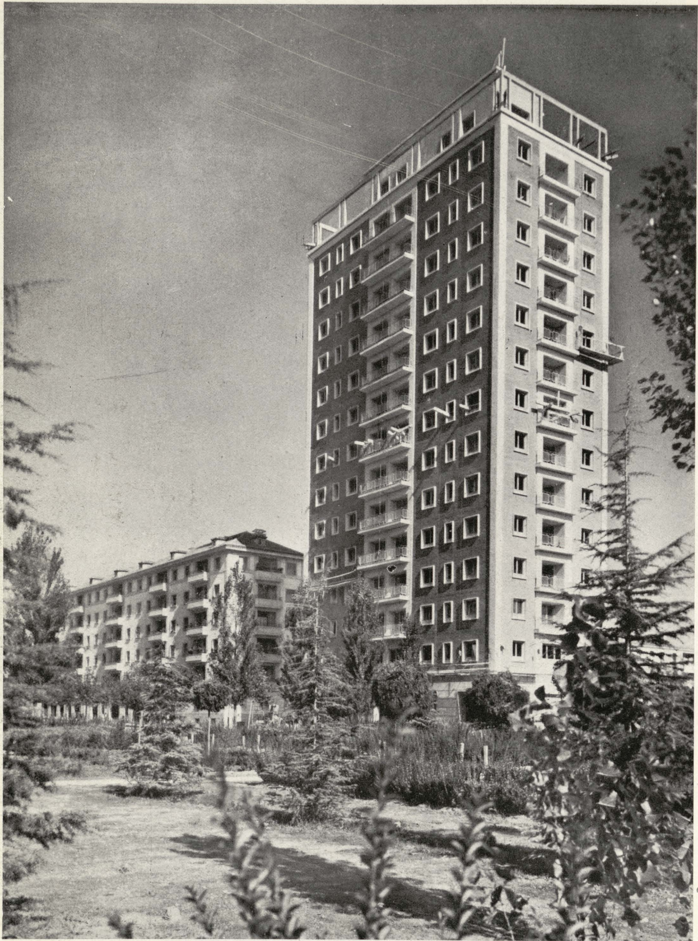
Bloque de altura en la iniciación de la Avenida de la Iglesia y Avenida del General Perón, en el Sector NE. de Cuatro Caminos.