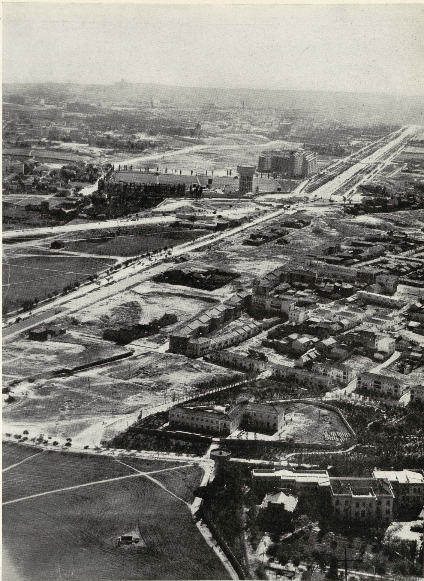
Acceso en construcción de la carretera de Francia por Irún en contacto con el suburbio de la Ventilla y enlace en la Avenida del Generalísimo.