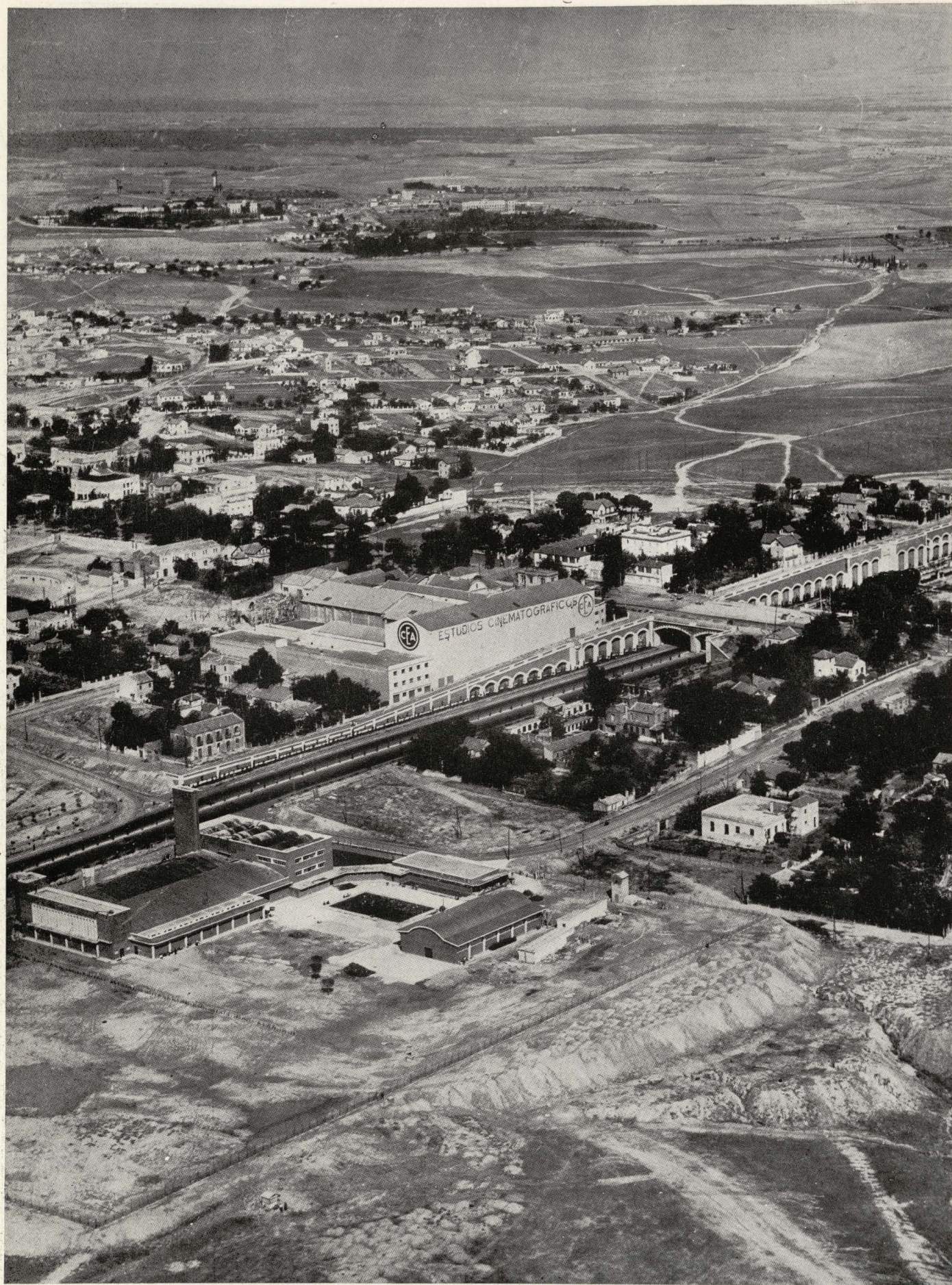
Aspecto parcial de la autopista de Barajas.