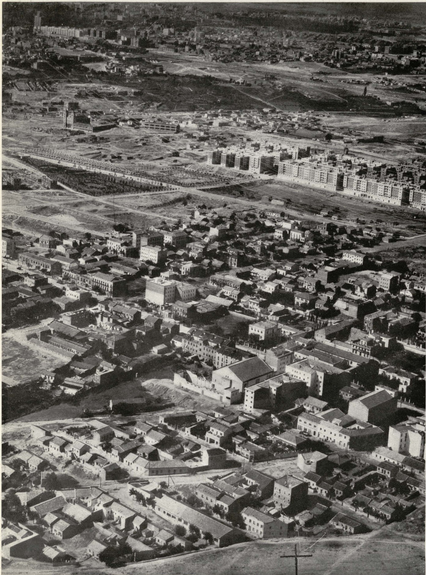
Parque y edificaciones en el Sector del Calero.