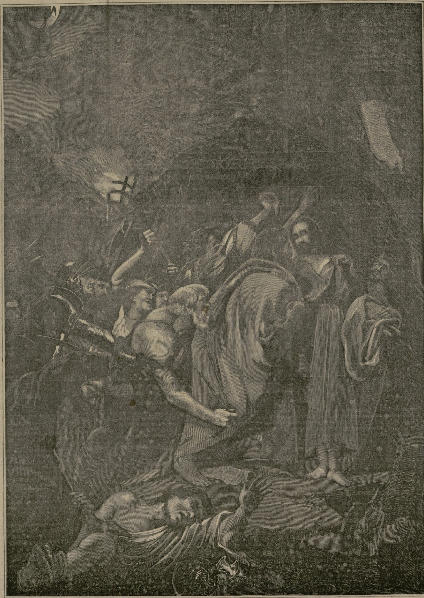
El prendimiento de Cristo.

Fué pintor de Carlos I de Inglaterra, y murió en Londres el año de 1641.