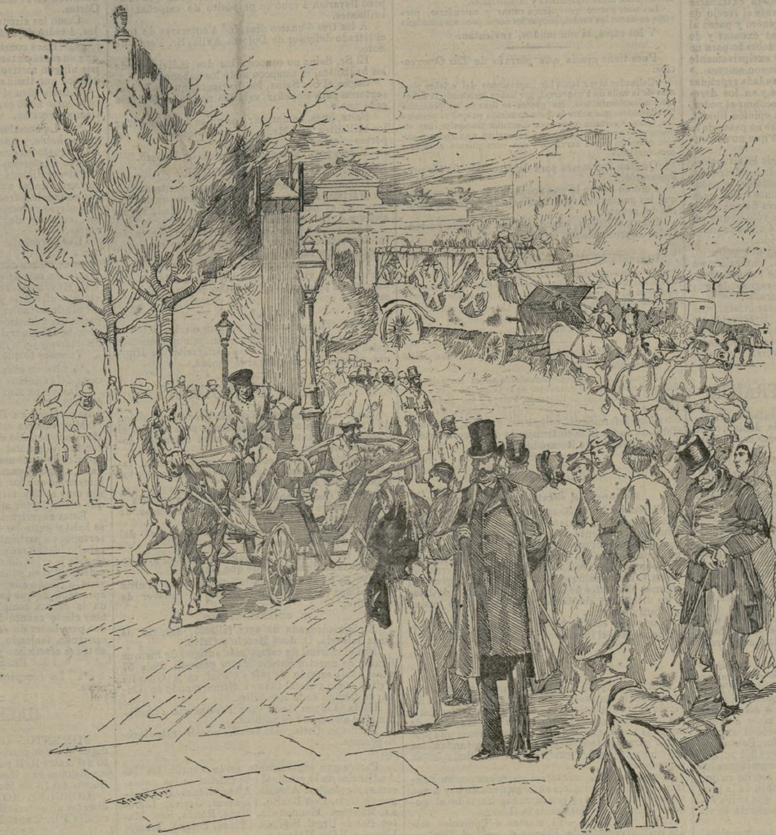
La vuelta de los toros.