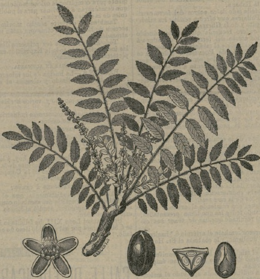
El árbol del incienso.