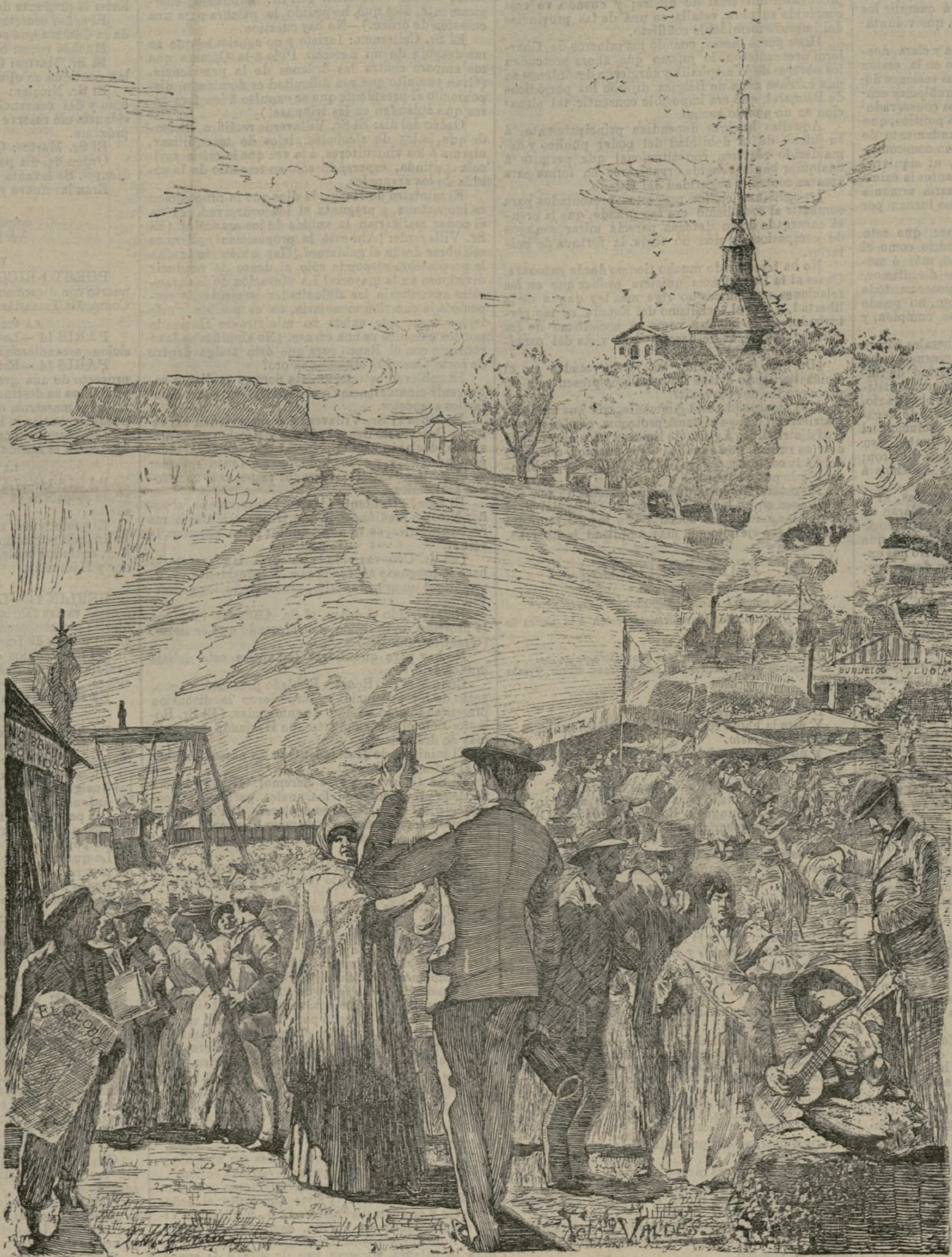
La pradera de San Isidro.

La tolerancia del ordinario permitió que fuese en progresión ascendente el culto, que se celebraban fiestas y vigiliass y se aplicase la reliquia del santo varón a los enfermos. Al fin Paulo V acordó la beatificación en 1619, y Gregorio XV le canonizó en 1622, lo cual dió motivo a lucidísimos festejos reales.